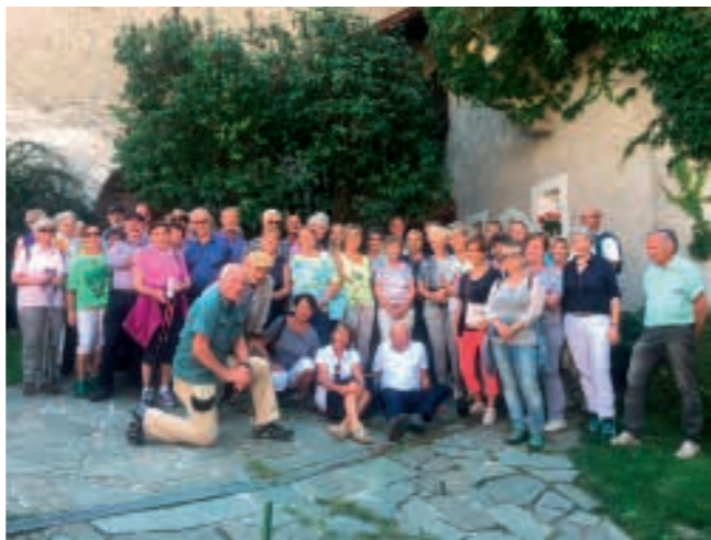
Foto im Burghof Reifenstein

Nach der Burgbesichtigung konnten wir bei herrlichem Wetter in Sterzing noch einen Stadtbummel unternehmen