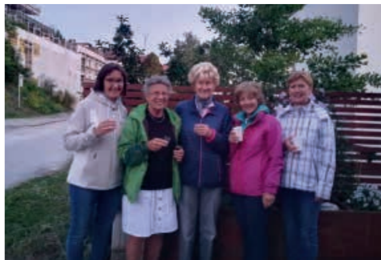
verabschiedet in den Familienverbandruhestand