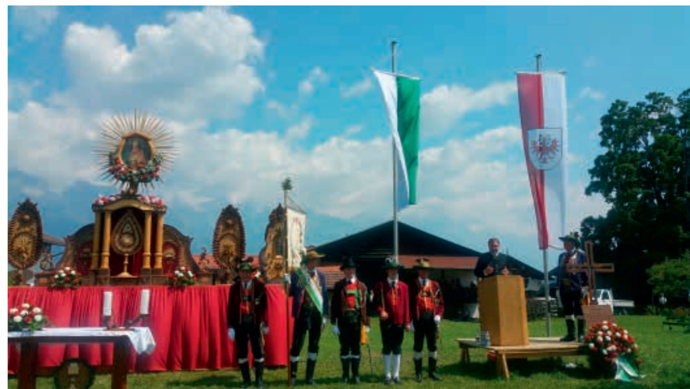
Günther Platter bei der Festrede am 1. Juli 2018 nach der Feldmesse in Mutters