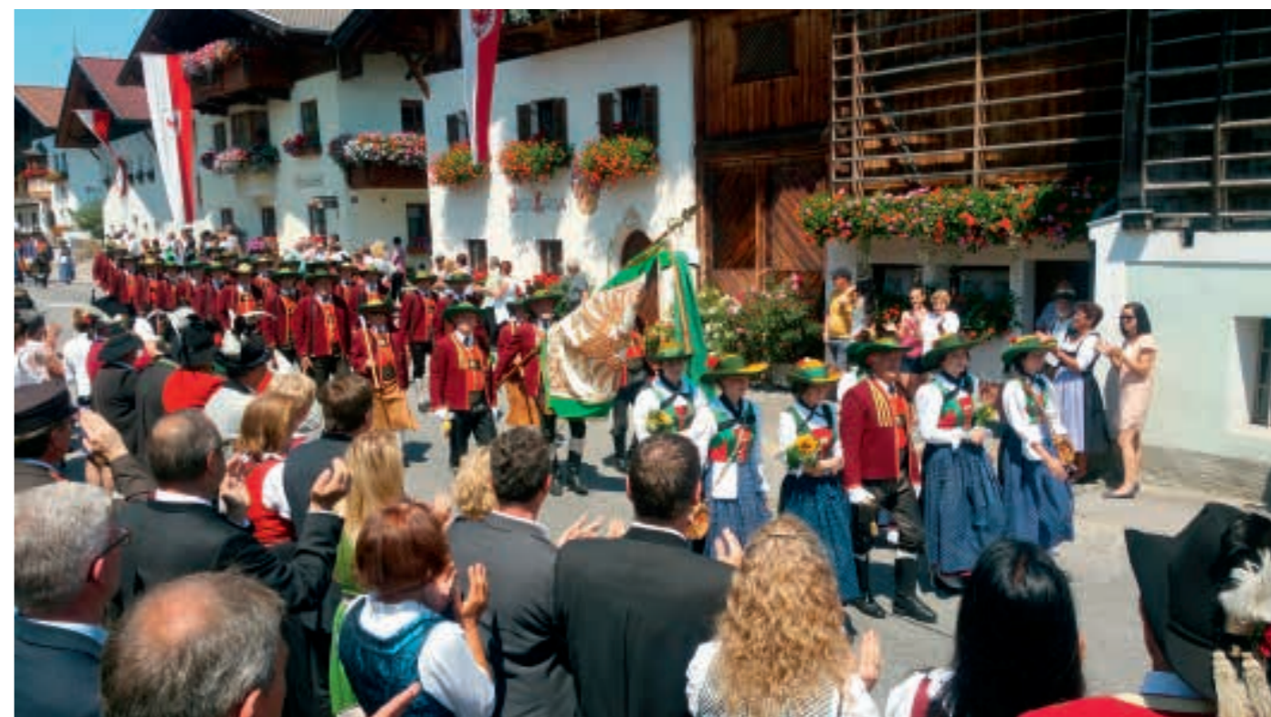
Defilierung der Patscher Kompanie vor prächtiger Kulisse der Mutterer Dorfstraße