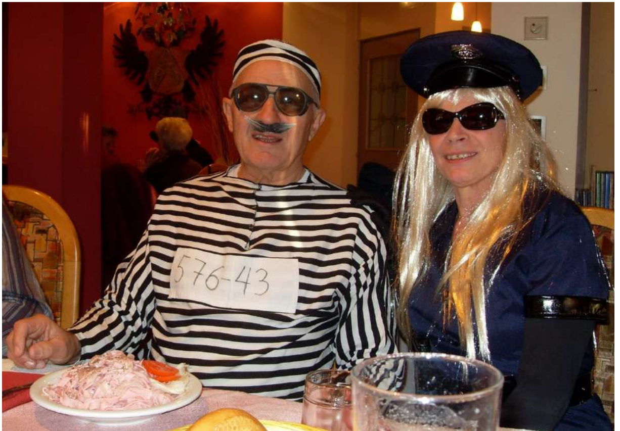
Faschingsfeier am 6. Februar - Seniorenbund Roppen.