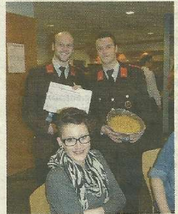
Beim Schätzspiel musste man erraten, wie viele Nudeln sich im Feuerwehrhelm befinden.

spät in die Nacht wurde gefeiert, getanzt und gelacht und um vier Uhr wurde ein Shuttledienst für die Gäste angeboten, damit sie sicher nach Hause kamen.