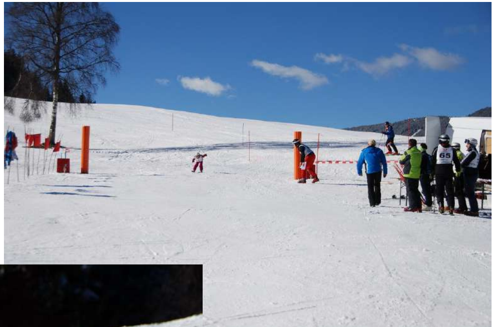
Bilder vom Dorfschirennen am 23. Februar 2014