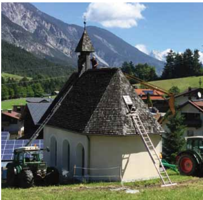
Arbeiten an der Kapelle in Waldele.