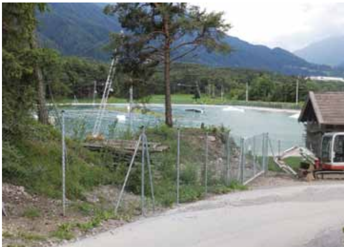
„STOP“ heißt es beim östlichen Zugang zum Ötzbrucker Waalweg

Waalweg von Richtung Osten her bzw. zwingt zur Umkehr, falls man den Steig vom Westen her begeht. Dem Vernehmen nach wurde die Sperre des Pfades auch von einer Waldanrainerin und Durchfahrtsberechtigten bei der BH Imst angezeigt. Auch wenn es sich um ein Privatgrundstück handelt, gilt eigentlich nach dem Forstgesetz, dass Jedermann den Wald zu Erholungszwecken betreten und sich dort aufhalten darf. Man darf gespannt sein, wie die Behörde das sieht.