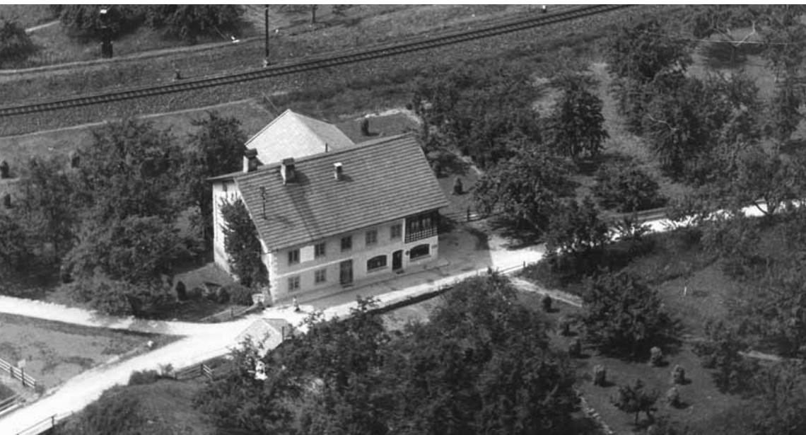
Das damalige Haus der Gemischtwarenhandlung Hilmbauer, 1959

(rb) „Man trägt doch eine eigentümliche Kamera im Kopfe, in die sich manche Bilder so tief und deutlich einätzen, während andere keine Spur zurücklassen.“