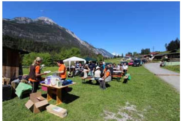
Für das leibliche Wohl war bestens gesorgt.