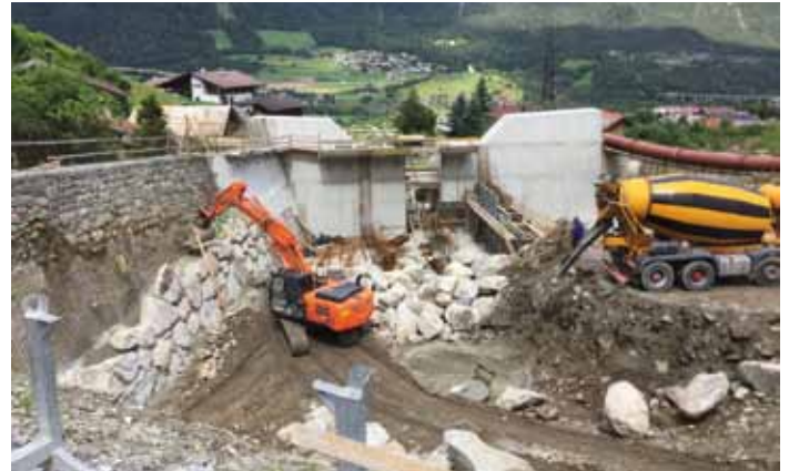
Die Arbeiten bei den Rückhaltesperren gehen zügig voran

wird die Sperre bei der Bachqueerung neu errichtet und anschließend werden von der Quellstube abwärts die alten Sperren durch neue ersetzt. Angesichts der heurigen Wetterlage mit viel Starkregen freuen wir uns über den zügigen Baufortschritt.