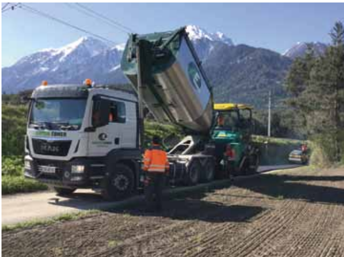
Aufgrund einer großzügigen Förderung konnte der Weg durch die Ötzbrucker Felder auf einer Länge von ca. 550 lfm asphaltiert werden. Alle Wegbenutzer freuen sich über die staubfreie Strecke ohne Schlaglöcher.