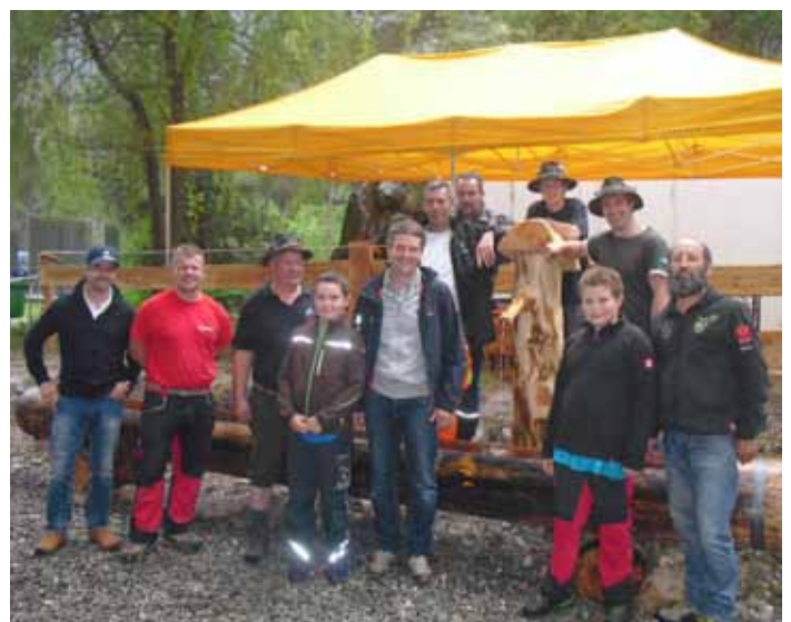
Danke an das tolle Team, das die Brunnen repariert hat.