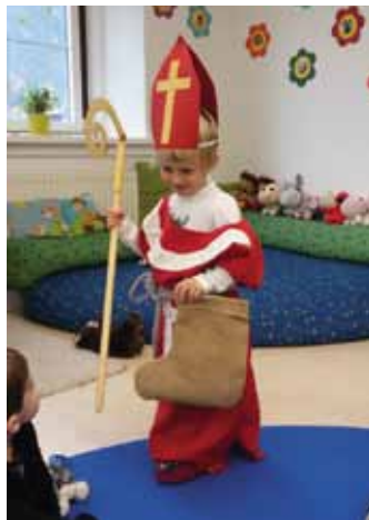
Wir feiern Nikolaus

Das Fest des Hl. Bischof Niko- laus und die Adventzeit feierten wir in entspannter und besinn-