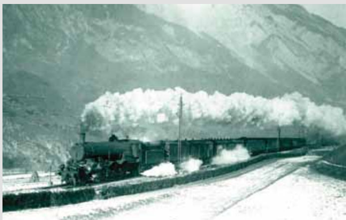
Schnellzug in Richtung Arlberg. Aufnahme 1924