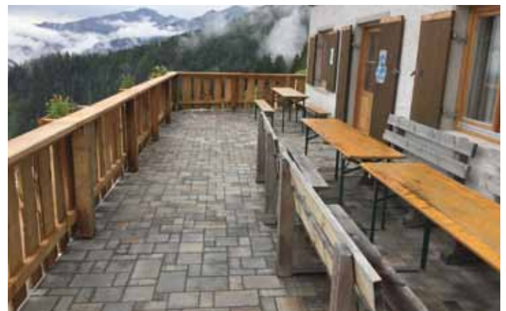
Gelungene Arbeit der Bauhofmitarbeiter auf der Maisalm.

baufällige Zaun erneuert. Auch die Grillstelle und die Kinderspielhütte sind neu errichtet worden. Diese Baumaßnahme ist sehr gut gelungen und verschafft der Maisalm ein schönes Erscheinungsbild.