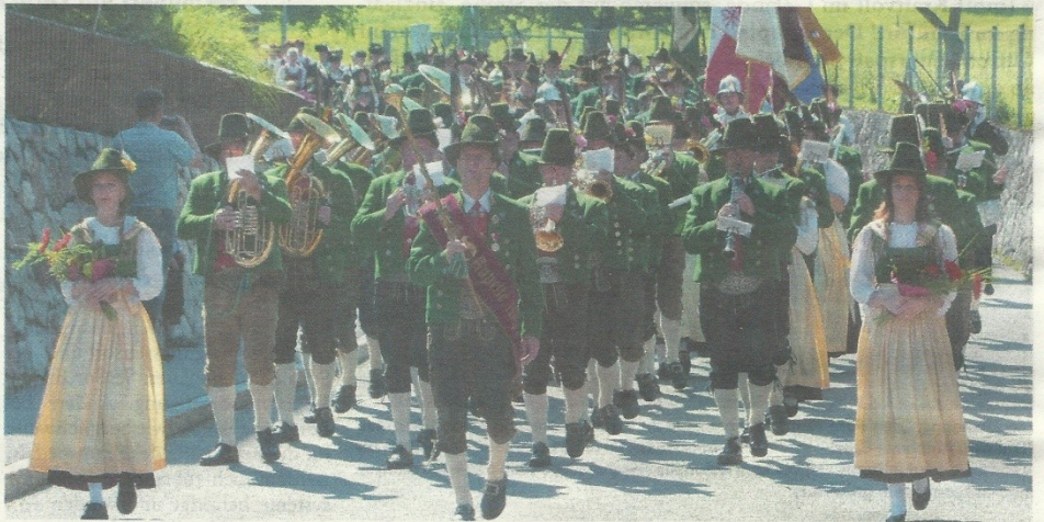
An den beiden Festtagen werden vom Team der Musikkapelle den BesucherInnen Grillhendl, Fassbier, eine Schnaps- & Mixgetränke-Bar, Kuchen und Kaffee (am Kirchtag) sowie viele andere Köstlichkeiten angeboten.

Im Anschluss ab ca. 22 Uhr wird die Band „Austro 3“ für Stimmung im Publikum sorgen. „Austro 3“ steht für bodenständigen und mitreißenden Dialektpop und Melodien, die ins Ohr gehen. Hier wird originale Austro-Musik von Künst-