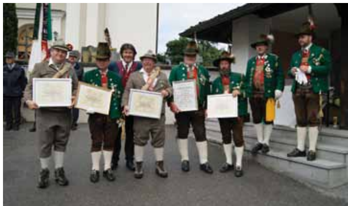
Die Geehrten der Schützenkompanie Roppen.

Wie gehabt fanden auch heuer wieder die Ehrungen am Herz Jesu statt.