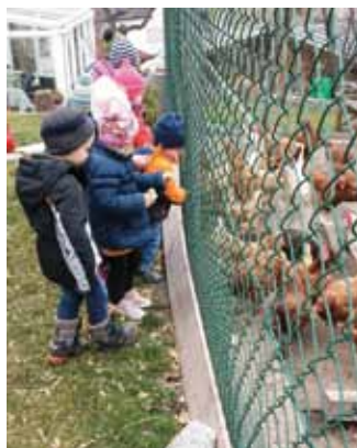
Besuch bei „Zachers Brigitte“

endlich in die Höhe kletterten, stand auch dem Spaß mit Wasser nichts mehr im Wege.