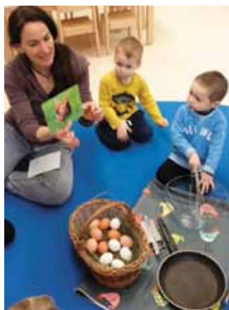
Wir machen Rühreier

Ostern und den Osterhasen, be- suchten einen Hühnerstall und machten Rühreier.