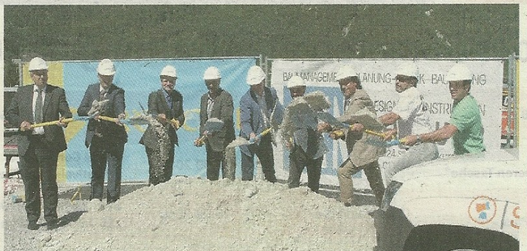
Mit vereinten Kräften wurde der Spatenstich in Angriff genommen. Supersnow setzt mit seinem neuen Werk auf kurze Wege zu den Skigebieten der Alpen.