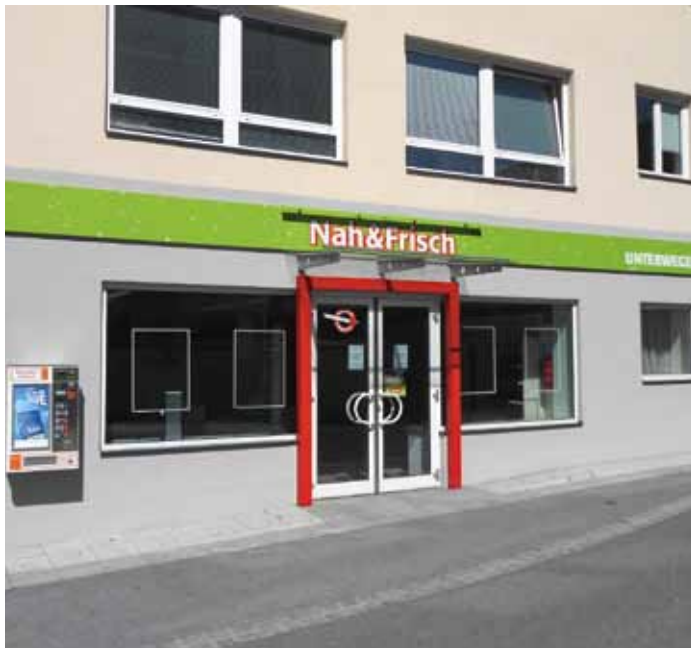
Das Geschäft bleibt vorerst geschlossen

Roppen bleibt vorerst ohne Lebensmittelgeschäft