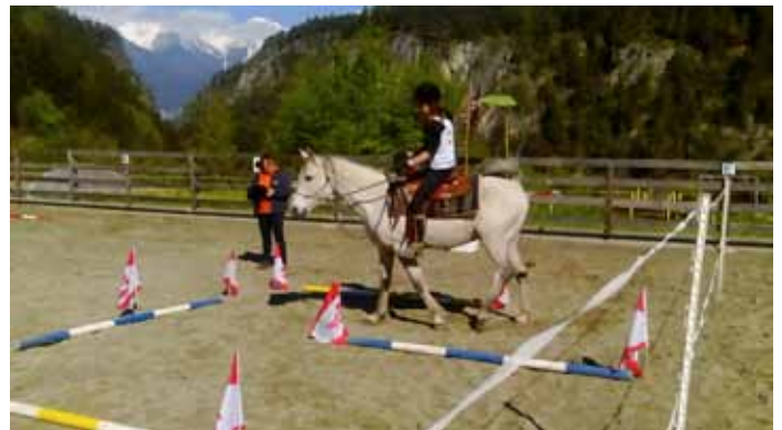
Spaß und Geschicklichkeit standen im Vordergrund.