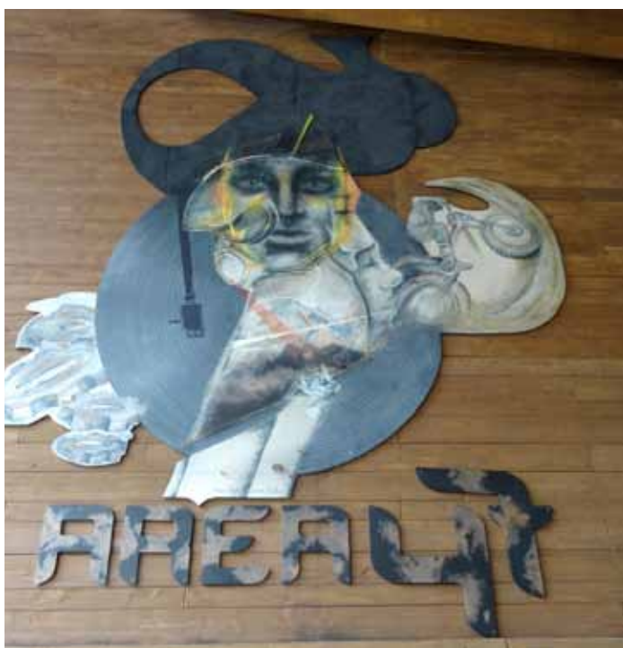
Das Werk der jungen Künstler in der Area47.

Fokus des Betrachters und spiegeln dabei perfekt die Kernthemen des Outdoor-Freizeitparks Area47 wieder. „Mit Profilsichten deuten wir auf die Vielschichtigkeit des Sportes, der Musik und der Menschen hin. Mit dem Motocrossfahrer hingegen wollten wir die Leidenschaft zum Extremen, dem Adrenalin, ein Gesicht geben. Diese Leidenschaft auf dem Bild wiederzugeben spielte für uns eine tragende Rolle“, berichteten die Künstler. Dieses Bild spiegelt nicht nur die Individualität der Freizeiteinrichtung Area47, sondern auch der Künstler wieder und lässt auf weitere großartige Werke hoffen.