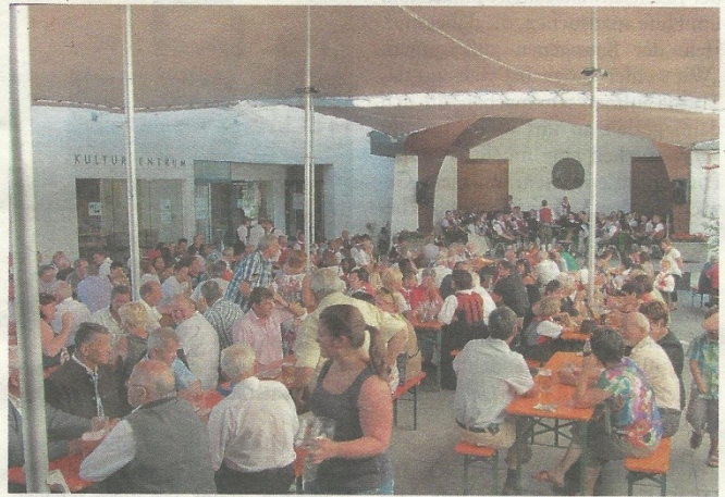
Die MusikantInnen freuen sich sehr auf einen regen Besuch der Veranstaltungen im gemütlichen Ambiente mit heimischer Volks- und Schlagermusik.