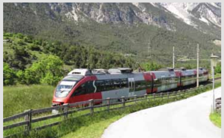
Die Ansicht heute (2016)