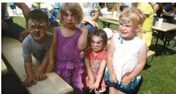
Abschlussfest im Garten der Kinderkrippe

Die Kinderkrippe startet wieder am 05.09.2016