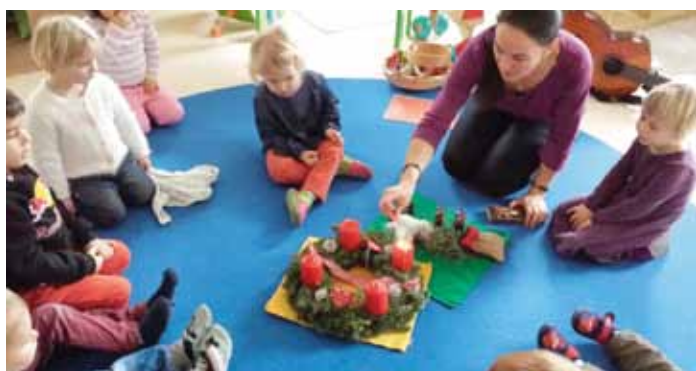
Wir feiern den Advent