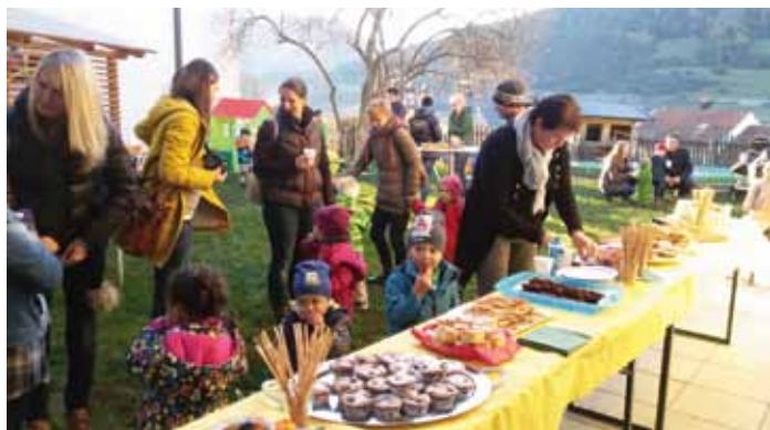
Martinijause im Garten der Kinderkrippe