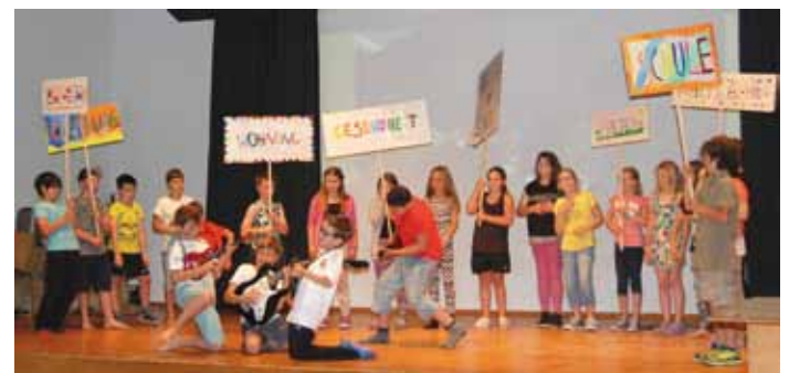
Das Robinson Kindermusical im Kultursaal.