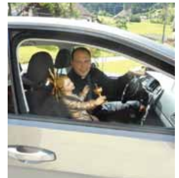
Wertvoller Transport, der auch angegurtet werden musste.