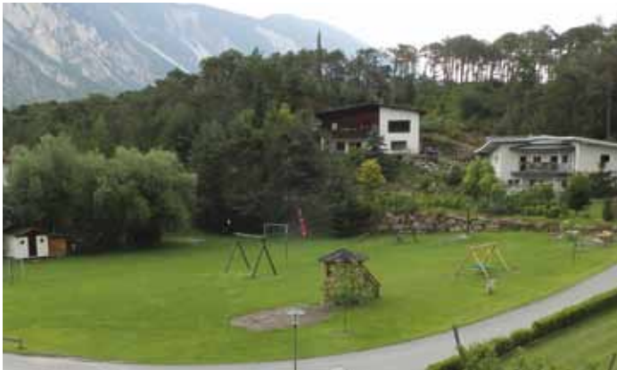
Bestens gewartet ist der Wolfauer Spielplatz

„Wolfauern“ betreut. Dazu wurde ein bisher gut funktionierender Plan erstellt, in dem jeweils 2 Personen 2 Wochen lang für das Mähen und das Aufräumen der Liegenschaft eingeteilt sind. Der Mähtraktor und der Trimmer gehören weiterhin den „Wolfauern“ und auch der benötigte Treibstoff für diese Geräte wird aus der „Wolfau-Kasse“ bezahlt. Eine enorme Bereicherung stellt der neu errichtete Brunnen am Wolfauer Spielplatz dar. Er wurde von der Firma Gstrein+Partner ZTGmbH aus Imst spendiert - herzlichen Dank dafür! Die Kinder freuen sich sehr über die Neuerungen und nutzen den neuen Spielplatz mit Begeisterung.