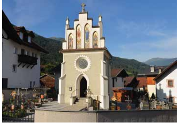
Der „Untere Friedhof“. Die Augen sollte man immer am Boden haben. Unangenehm, wenn man in ein Hundehäufchen tritt.

Tatort „Unterer Friedhof“: Dort verrichtet seit dem Frühjahr fast täglich ein Hund seine Notdurft. Viele Friedhofsbesucher haben bereits unangenehme Bekanntschaft mit den unappetitlichen Hundehäufchen gemacht, der Ärger ist groß.