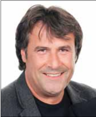
Bürgermeister Ingo Mayr