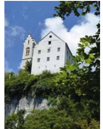
Wallfahrtskirche St. Georgenberg