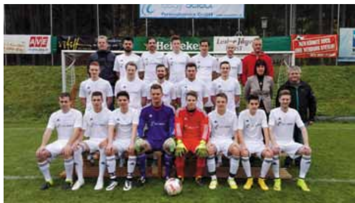
Hervorragender 5. Platz für die Kampfmannschaft