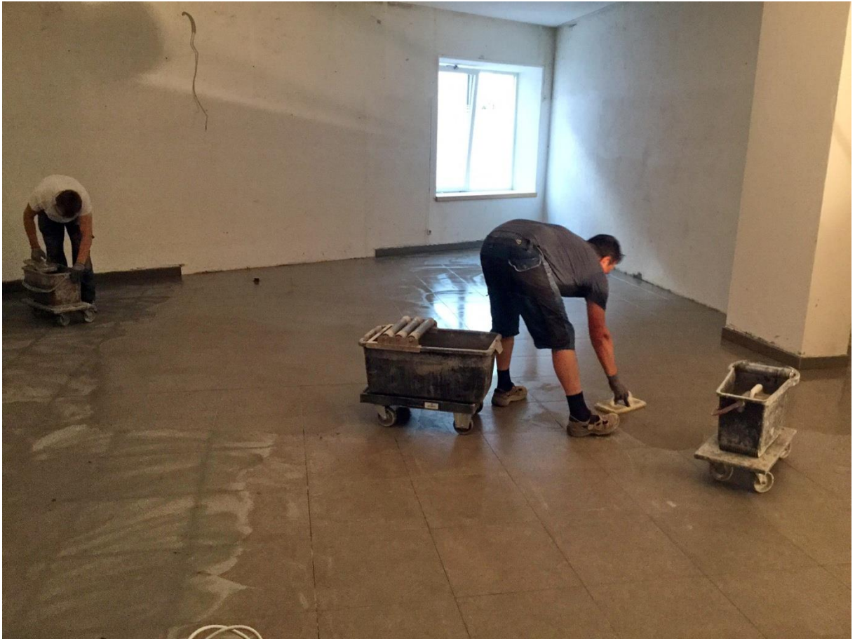
Umbau - Adeg Geschäft