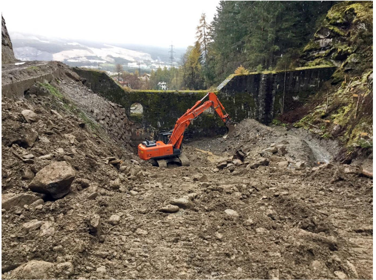
Oberängern - hintere Sperre