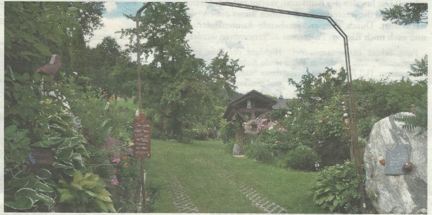
„Wenn die Seele Urlaub braucht, dann geh in den Garten“, steht am Eingang zum Garten der Sinne.