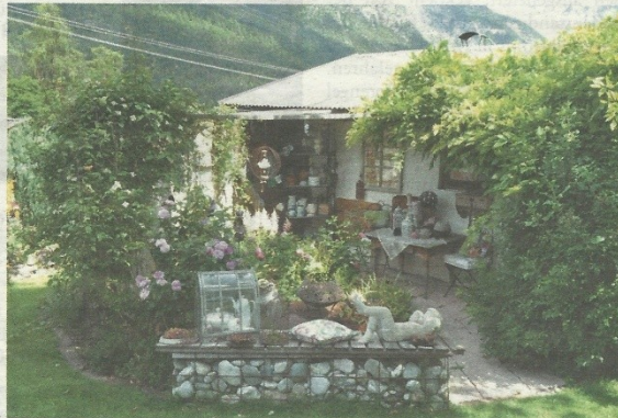
In der Flohmarkttrödelecke findet sich allerhand alter Hausrat.