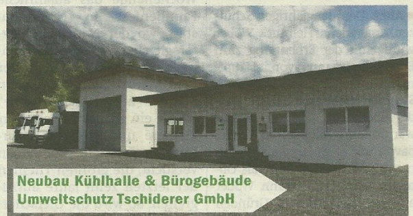
Neubau Kühlhalle & Bürogebäude Umweltschutz Tschiderer GmbH

Spezialentsorgungsbetrieb für tierische Nebenprodukte der Kategorien 1-3