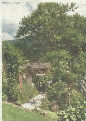
Verschlungene Wege führen zum Gartenträumeplatz.

welche Pflanzen sich mit welchen Nachbarn gut verstehen. Gedüngt wird mit hauseigenem Rossmist, die Schnecken soll ein Kupferband vom Hochbeet fernhalten und Unkraut muss eigentlich nur noch im Frühjahr gejätet werden. Dass der Garten viel Arbeit gemacht hat, bis er sich zur heutigen Schönheit entwickelt hat, sieht man ihm an und dass er heute zum Ort der Erholung herangereift ist, hat sich die Gärtnerin wohl wirklich verdient.