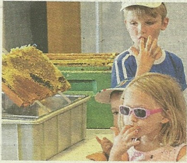
An den Bienenwaben durften die Kinder direkt den leckeren Honig kosten.