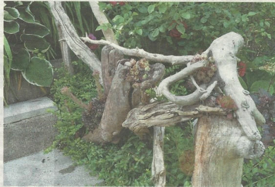
Liebevolle Details wie das Hauswurz-Schwemmholz-Geländer lassen den Besucher immer wieder Neues entdecken.

laden zum Verweilen ein. Beim Wasserruheplatz lassen sich Koyos und Libellen bewundern und überall finden sich alte Gerätschaften und Dinge, die nur mehr entfernt an ihre ursprüngliche Verwendung im Handwerkstum vergangener Tage erinnern. Frei nach dem Permakulturprinzip probiert Thaler aus,