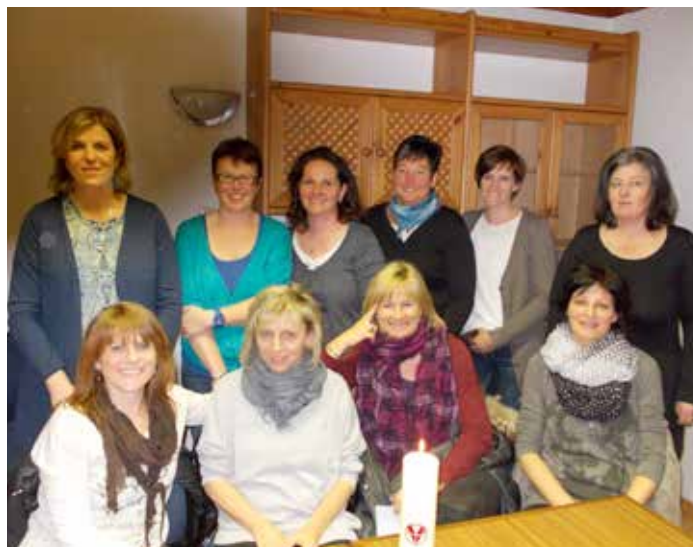
Mitglieder der Vinzenzgemeinschaft

Die Finanzierung erfolgt durch Spenden. Die Mitglieder arbei- ten ehrenamtlich. Dadurch kommen die Mittel ausschließlich den Hilfsbedürftigen zu Gute.