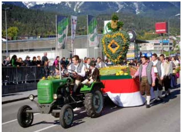
Der festlich geschmückte Erntedankwagen der Roppner Jungbauern beim großen Festumzug in Imst

Pünktlich um 14.00 Uhr trafen die Almhirtin mit ihren Helfern und Rindern beim Schulhausplatz ein, um dort beim Almbtriebsfest - veranstaltet von der Jungbauernschaft - den anstrengenden Tag gemütlich bei Speis und Trank ausklingen zu lassen. Im kommenden Jahr feiert die Familie Pohl übrigens bereits ihr 20. Jahr als Hirten u. Pächter der Maisalm. (gem)