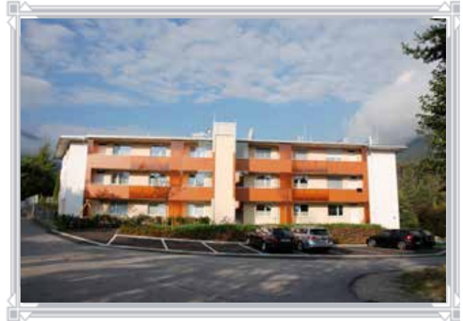
Die neu errichtete Wohnanlage am Bugglweg