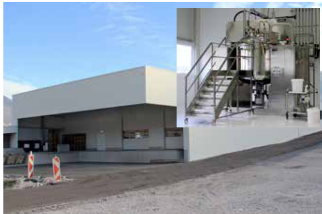
Das Betriebsgebäude von „A pure green source“