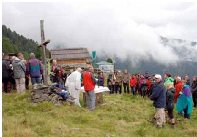
Die Ortsgruppe Roppen des Österr. Alpenvereines feierte am 1. September das 20-jährige Bestandsjubiläum

Nach 10 Jahren Pause (2003) nahm die Musikkapelle Roppen heuer bereits zum 9. Mal am großen Festumzug anlässlich der Eröffnung des Münchner Oktoberfestes teil. Bereits um 06.30 Uhr des 22. Septembers erfolgte