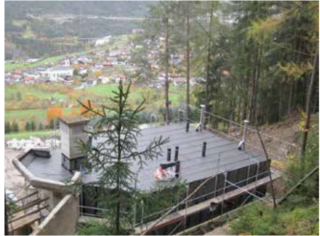
Der Hochbehälter in Oberängern musste dringend saniert werden.

Die Kosten liegen bei circa Euro 200.000 - eine wichtige Investition für die Qualität unseres Trinkwassers. (Vbgm. Günter Neururer)