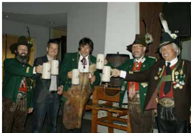
Das Kirchtagsfest 2013 der Schützenkompanie wurde zünftig mit einem Bieranstich eröffnet.