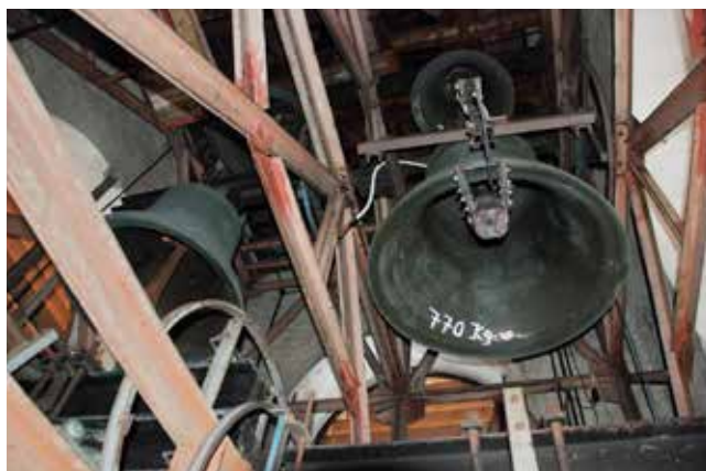
Der sanierungsbedürftige Glockenstuhl