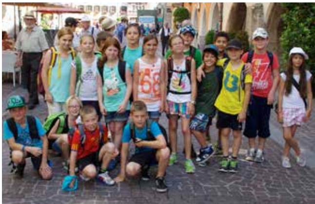
Die Volksschul-Abschlussklasse 2012/13

Damit am Ende der 4 Jahre Volksschule eine Innsbruckfahrt und sonstige gemeinsame Aktivitäten gemacht werden konnten, eröffneten wir in der 2. Klasse ein Sparbuch. Die Erlöse aus Kuchenverkauf an den Elternnachmittagen, gesunde Jause usw. wurden auf dieses Sparbuch eingezahlt. Durch die Mithil-