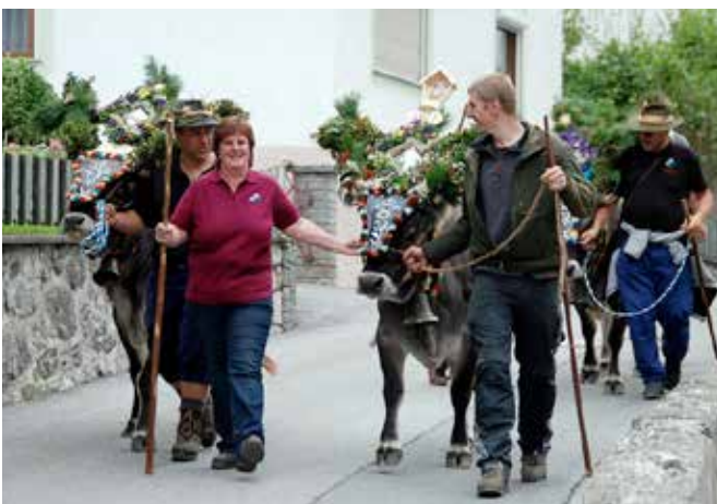
Der Almbtrieb 2013 fand am 14. September statt. Kommenendes Jahr feiert Fam. Pohl das 20-jährige Jubiläum

Am Sonntag, den 13. Oktober 2013 fanden in vielen Orten die Erntedankfeste statt. In Roppen begleiteten die Formationen den von der Jungbauernschaft festlich geschmückten Erntedankwagen um 09.45 Uhr vom Löckpuitter Platzl zur Pfarrkirche, wo eine Segnung der Gaben und die Heilige Messe abgehalten wurde. Der Wagen und die Musikkapelle mussten allerdings dann gleich nach Imst aufbrechen, um dort um 11.00 Uhr am großen Erntedankfestumzug des Bezirkes Imst vom Pflege- zum Agrarzentrum teilzunehmen. Im Anschluss hatte die MK Roppen noch die Aufgabe, die von Abt German Erd zelebrierte Heilige Messe musikalisch zu umrahmen. (wr)