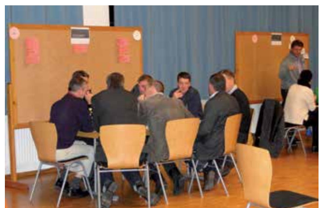
Mitarbeiter des REGIO-Vereins

Diese Gruppen sollen bis zum Frühjahr des kommenden Jahres einzelne förderbare Ziele in den jeweiligen Themenbereichen konkretisieren, damit die neuerliche Bewerbung als Leader-Region