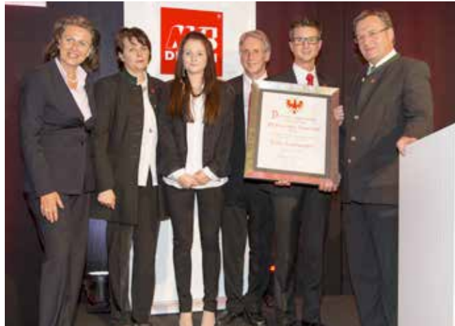
Verleihung des Tiroler Landeswappens an die Geschäftsführung von MS-Design