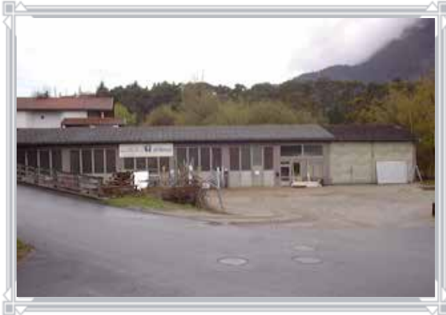
Das ehemalige Parth- bzw.- Ambrosi-Betriebsareal