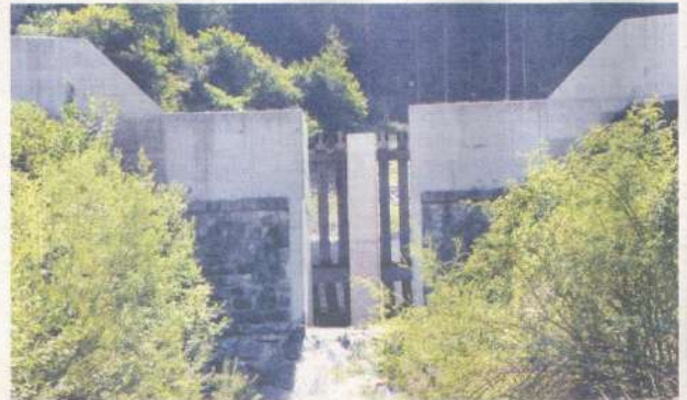
Verbauung Unterlauf des Leonhardsbaches abgeschlossen: Seit 1912 ist die schrittweise Zählung des „schlafenden Riesen“ ein zentrales Thema in Roppen. Ein ganz wesentlicher Abschnitt konnte jüngst beendet werden.

VON KINDERGARTEN BIS GEWERBEPARK. Auch beim Neubau des Kindergartens geht was weiter. Nach Wunsch sollten die Einrichter im Oktober kommen, danach könne übersiedelt werden. Für 120 Kinder entstehen vier Kindergartengruppen und drei Einheiten für die Kinderkrippe.