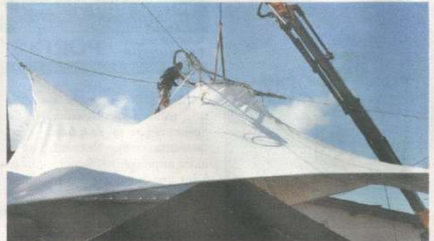
Die Schulplatzüberdachung mit einer festen, hängenden, platzüberspannenden Membran schreitet zügig voran. Kernstück dabei ist das 485 Quadratmeter „Zelt“ in solider, begehbarer Ausführung.