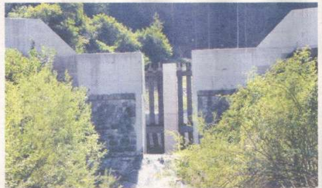
Verbauung Unterlauf des Leonhardsbaches abgeschlossen: Seit 1912 ist die schrittweise Zähmung des „schlafenden Riesen“ ein zentrales Thema in Roppen. Ein ganz wesentlicher Abschnitt konnte jüngst beendet werden.

VON KINDERGARTEN BIS GEWERBEPARK. Auch beim Neubau des Kindergartens geht was weiter. Nach Wunsch sollten die Einrichter im Oktober kommen, danach könne übersiedelt werden. Für 120 Kinder entstehen vier Kindergartengruppen und drei Einheiten für die Kinderkrippe.