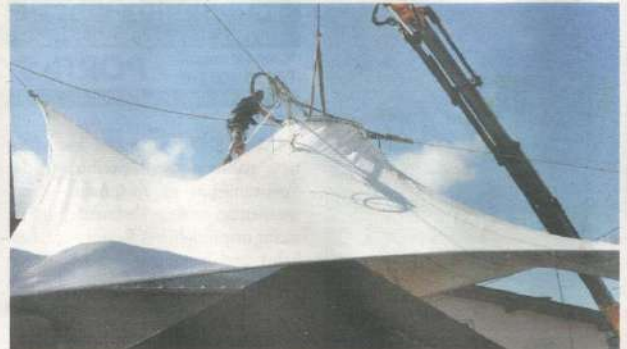
Die Schulplatzüberdachung mit einer festen, hängenden, platzüberspannenden Membran schreitet zügig voran. Kernstück dabei ist das 485 Quadratmeter „Zelt“ in solider, begehbarer Ausführung.