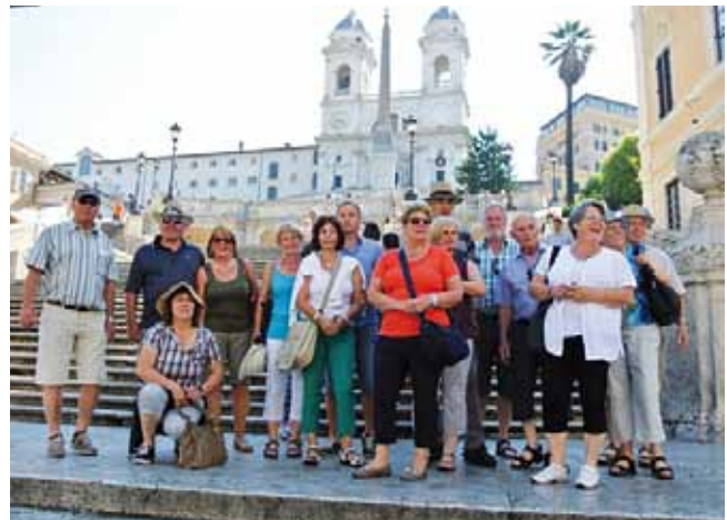
Die Roppner Pilger auf der „Spanischen Treppe“

andere wiederum bahnten sich einen Weg in die Sixtinische Kapelle. Wir besuchten Santa Maria Maggiore, San Lorenzo fuori le Mura, San Paolo fuori le Mura. In der Kirche San Sebastiano feierten wir gemeinsam eine Hl. Messe