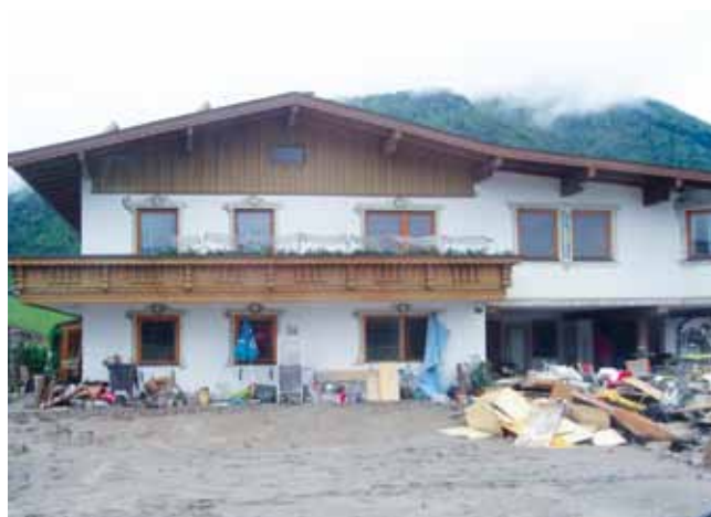
Enorme Schäden durch das Hochwasser

Die Mannschaft war vom 3. bis 4. Juni 2013 in Kössen im Einsatz. Übernachtet wurde im Heeresleistungszentrum Hochfilzen.