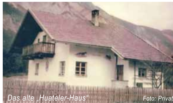
Das alte „Huateler-Haus“