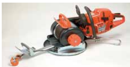
Seilwinde der Fa. Falkner

Der Familienbetrieb überzeugt durch sehr große Erfahrung bei der Konstruktion und Fertigung von qualitativ hochwertigen land- und forstwirtschaftlichen Maschinen, Umwelt-