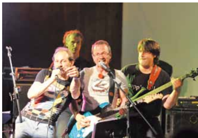
„Stars n´Stripes OG“ begeisterten die Fans