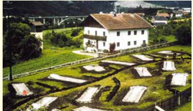
Die Minigolfanlage am jetzigen Turnsaalparkplatz

gelangte die Bitte an den Bürgermeister, die Staubfreimachung der Wege durch das ganze Dorf zu forcieren. Bei