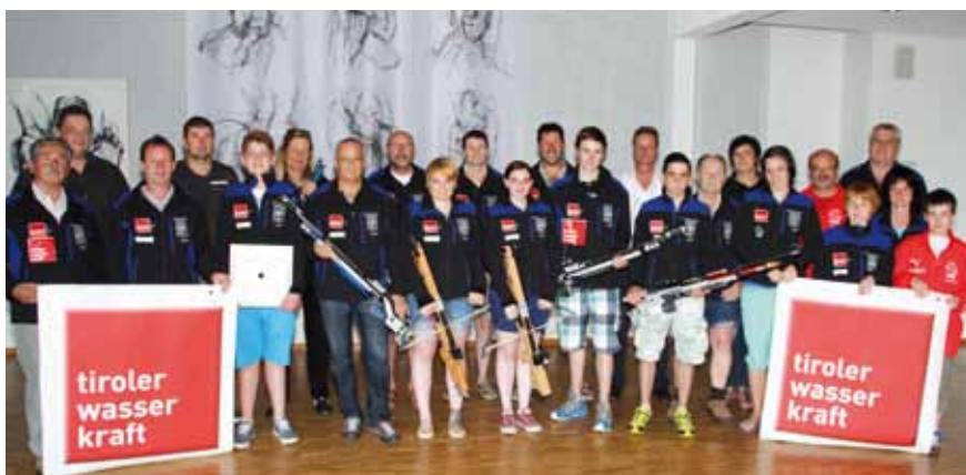
Die Wettkampfschützen der Schützengilde Roppen