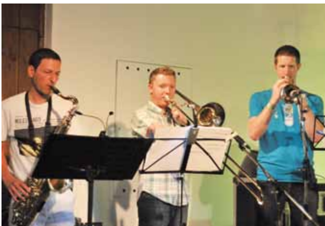
Der tolle Bläusersatz von „ReCycle Deluxe“