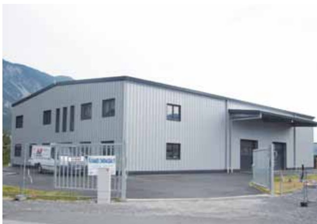
Betriebsgebäude der Fa. Praxmarer-Innenausbau