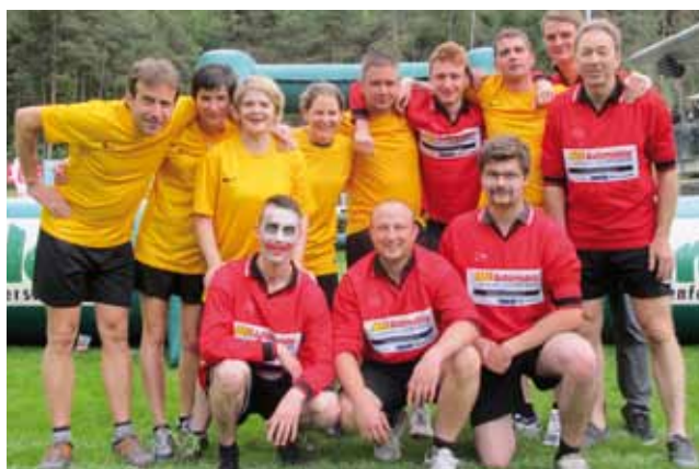
Die Feuerwehr (rot) siegte knapp vor „Er & Sie“

Vom 17. bis 19. Mai 2013 standen am Sportplatz mehrere Veranstaltungen und Festlichkeiten im Rahmen des Fußball-Pfingstturnieres auf dem Programm. Freitagabends matchten sich vier Altherrenmannschaften aus der Umgebung. Den Sieg holten sich dabei unsere "Oldboys" vom FC-80 Roppen. Im Anschluss sorgten beim "Dirndl