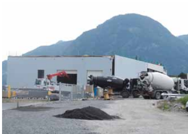
Große Baufortschritte auch bei „Pure Green Source“

Mit dem Trockenbaufachbetrieb Praxmarer zog vor wenigen Wochen ein neues Unternehmen in den Gewerbepark ein.