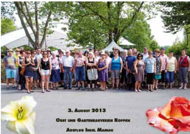
Der Obst- u. Gartenbauverein unternahm im August bei sommerlicher Hitze einen Ausflug zur Insel Mainau

München das traditionelle 24 Stunden-MTB-Rennen statt. Dieses Jahr mischten erstmals 4 Biker vom "Biketeam Roppen" mit. Sie fuhren bei heißen Temperaturen auf einer technisch anspruchsvollen Strecke ein beachtliches Ergebnis ein. In Summe waren 111 Viererteams aus ganz Europa am Start, die Roppener Biker holten sich mit Kampf, Biss und Ehrgeiz den tollen 21. Platz. Der Start des 24h-MTB-Rennens erfolgte am Samstag um 12 Uhr und endete am Sonntag um 12 Uhr. Es wurde abwechselnd auf dem 8,5 km langen Rundkurs gefahren, doch trotz der Erholungsmöglichkeit in den Pausen, verlangte das Rennen den Teilnehmern alles ab. "Besonders in den frühen Morgenstunden waren die Strapazen des Rennens deutlich zu spüren. Umso glücklicher waren wir dann über den 21. Platz", berichteten die 4 Roppener Biker. Auf diesem Wege möchte sich das Biketeam Roppen bei den Sponsoren: "Metallbau Ambrosi", "Erdbau Prantl", "Wohnkompass", "Baumeister Adi Leitner" "dachform" und bei der "Rundschau" recht herzlich bedanken. (David Schuchter)