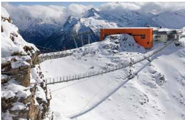
Hängebrücke Stubnerkogel in Bad Gastein

Seit bald 60 Jahren behauptet sich die Firma Falkner Maschinenbau am Markt. Verantwortlich dafür sind innovative Erfindungen und Patente sowie viel Kompetenz im Sonderstahlbau.