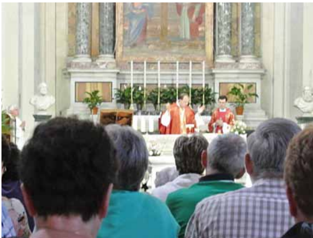
Hl. Messe im Petersdom (Fotograf. verboten...)

und stiegen anschließend ab in die Katakomben. Wir sahen San Giovanni in Laterano, Santa Grove in Jerusalem und Santa Maria in Aracoeli. Die Sommerresidenz des Papstes, Castel Gandolfo, fanden wir recht ruhig vor. Der Genuss von köstlichem römischen Kaf-