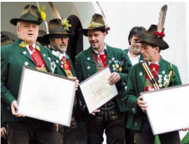
Die geehrten Mitglieder am Burschl