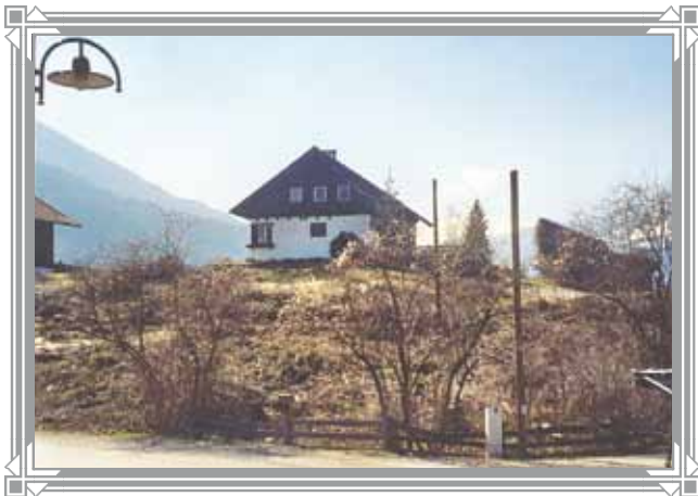
Das Försterhaus - erbaut 1930/31