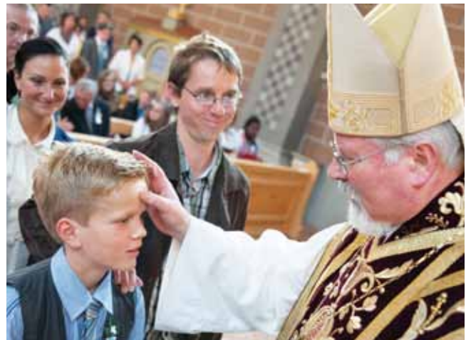
Abt German Erd spendete das Firmsakrament.