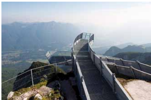
Aussichtsplattform AlpspiX in Garmisch

Zugute kommt der Firma hier neben der langjährigen Erfahrung und der Innovationsbereitschaft auch die