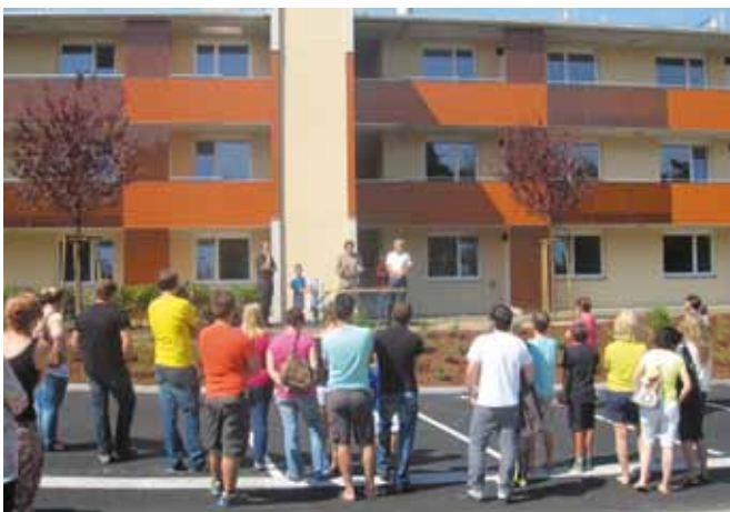
Im Juli 2013 erfolgte die Schlüsselübergabe für die neue Wohnanlage am ehemal. Parth-Areal in der Wolfau.

Der Vereinsausflug des OGV führte heuer auf die drittgrößte Insel im Bodensee. Dieses Kleinod, in großartiger Lage und mit schönem Rundumblick auf den Bodensee, wurde von Graf Lennart Bernadotte, der 1932 auf die Insel kam, zu einem weit über die Grenzen