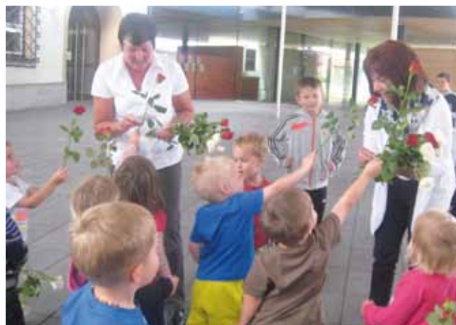
Die Kinder verabschiedeten sich mit Blumen