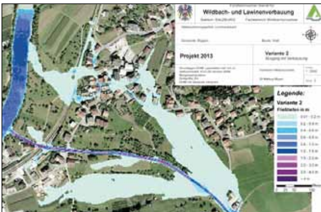
Vermurungssimulation in angenommenem Verklauungsfall