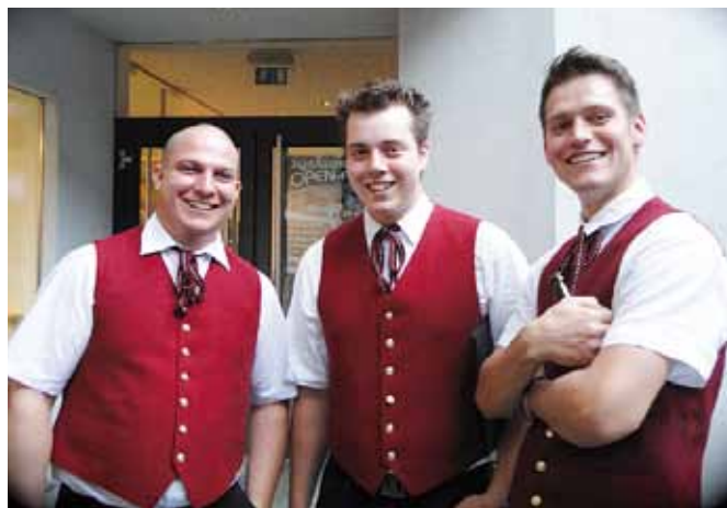
Auch die jungen Männerchormitglieder wirkten begeistert beim Vatertagskonzert „Männer mag man eben“ mit.