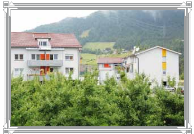
Die errichtete Wohnanlage, Aufnahme 2013