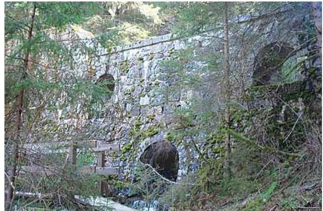
Renovierungsbedürftige historische Murensperre

Im Mittel- und Oberlauf sind die ergänzende Staffe- lung bzw. die Neuerrichtung von 29 Konsolidierungs- sperren in mehreren Baustufen geplant (Kostenschät-