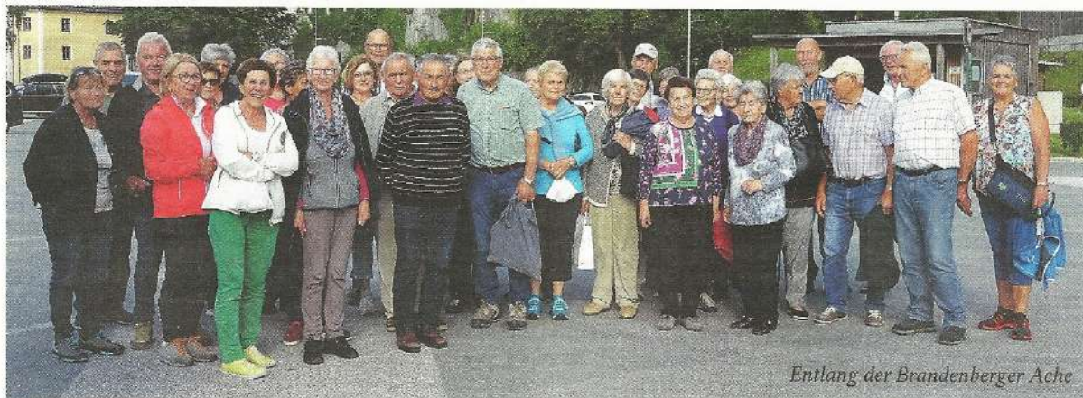
Entlang der Brandenberger Ache