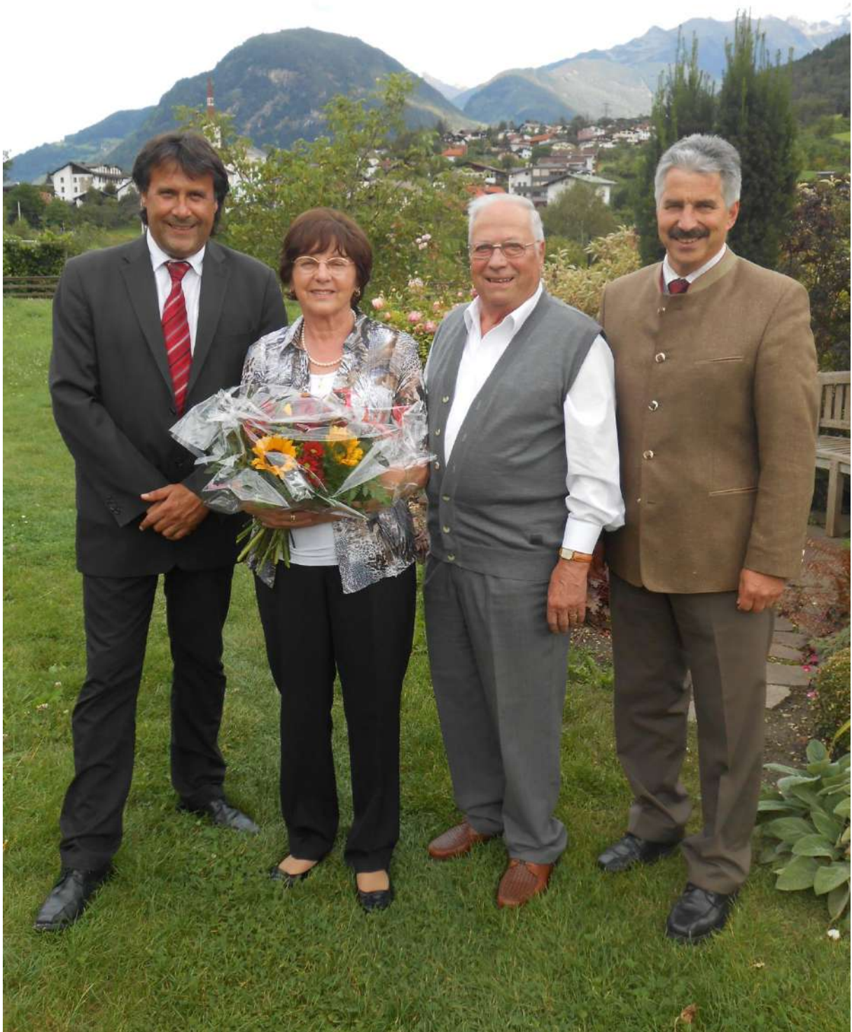
goldene Hochzeit - Fam. Heiss