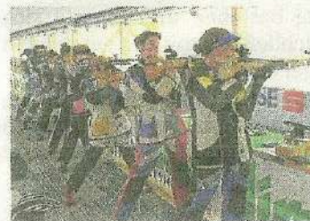
Die Öztalerin setzte sich in einem starken Starterfeld durch.