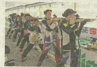
Die Öztalerin setzte sich in einem starken Starterfeld durch.