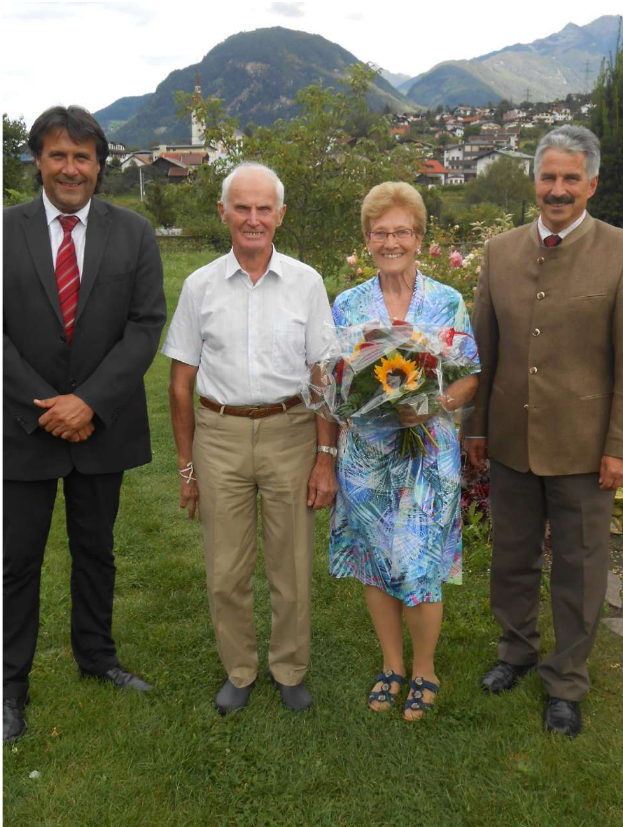
goldene Hochzeit - Fam. Raggl