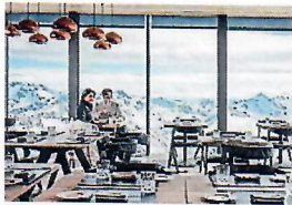
Beim Einkehren und Genießen in Sölden hat man überall die gleichen Tischnachbarn: die mächtigen Gipfel der Ötztaler Alpen.