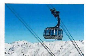
Mit den eleganten Gaislachkogelbahnen I und II werden die 1677 Meter Höhenunterschied in wenigen Minuten überwunden.

moser, dem Gestalter kühner Bauten in Söldens Skiwelt, hat es einst die Location-Scouts für Spectre dermaßen begeistert, dass Monate später Daniel Craig, Léa Seydoux und Co. am Gaislachkogel aufschlugen. Heute zieht es neben Filmfans vor allem Foodies aus nah und fern in das exquisite Restaurant (2 Hauben/13 Punkte von Gault & Millau 2024). Dank seiner genialen Architektur verspricht das ice Q an klaren Tagen faszinierenden Aus- und Weitblick bis in die Dolomiten im Süden oder zur nördlich gelegenen Zugspitze.