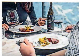
Mit 2 Hauben im Gault Millau Guide 2024 gehört das exklusive Gourmetrestaurant ice Q auch kulinarisch zur Spitze.