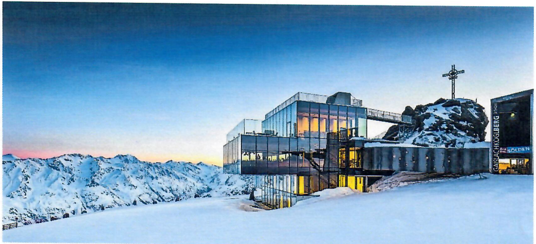
Österreichs höchstes Haubenrestaurant ice Q (2 Hauben) serviert feine Gourmetküche, erlesene Weine und eine Fernsicht zum Niederkrimen.

Das exklusive Gourmet-Restaurant ice Q findet sein Zuhause in einem durch und durch spektakulären Glas-kubus-Ensemble. Entworfen von Architekt Johann Ober-