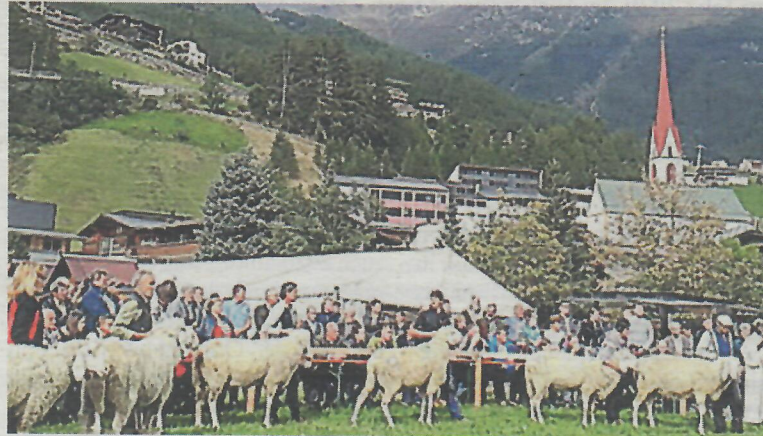
Der Schafzuchtverein Sölden-Zwieselstein lädt am 24. September zum Schaferfest (Gebietsausstellung) nach Sölden und freut sich bereits jetzt auf zahlreiche Besucher

ES WIRD GANZ GENAU HINGESCHAUT. Das Schaferfest in Sölden lädt zum Staunen und Genießen ein. Ein fester Bestandteil des Events ist das Preisrichten – los geht es ab circa 10 Uhr. Die fünf besten Tiere jeder Gruppe werden prämiert. Dabei achten die Preisrichter insbesondere auf