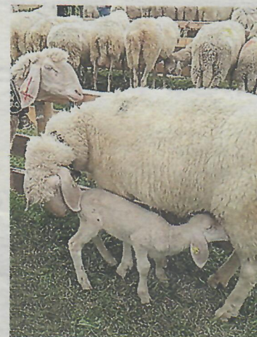
Nach einem angenehmen Sommer der Höhe, werden die Schafe mit einem großen Fest im Tal begrüßt.

Der Schafzuchtverein Sölden-Zwieselstein verwöhnt seine Gäste in Zusammenarbeit mit dem Hotel Central sowie den Bäuerinnen aus Sölden mit feinsten heimischen Speisen, wie zum Beispiel Lamragout oder Grillwürste vom Schaf.