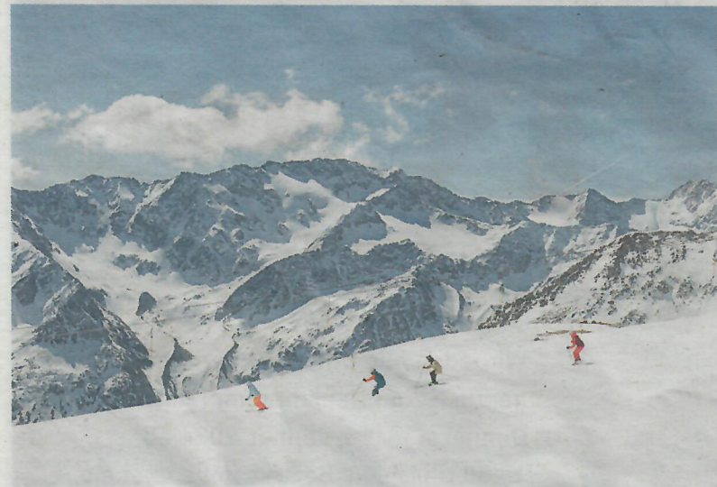
Jeder Skitag ein Erlebnis – für Tiroler:innen und Wintersportfans aus aller Welt.

HERAUSRAGENDE KULINARIK. Stilvolle Stärkung gefällig? In einen Martini – „Geschüttelt, nicht gerührt“ – und weitere erlesene Genüsse empfiehlt sich das Restaurant ice Q. spektakuläre Glaskubus-Ensemble auf den Füßen des Gipfelkreuzes. Entworfen von Architekt Johann Obermoser, der Gestalter kühner Bauten in Sölden. Skiwelt, hat es einst die Location