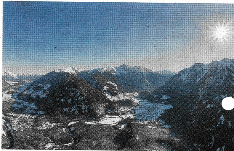
Das vordere Ötztal ist ein wahres Naturjuwel. Gäste und Einheimische finden hier ein attraktives Angebot an Outdoor-Aktivitäten vor.