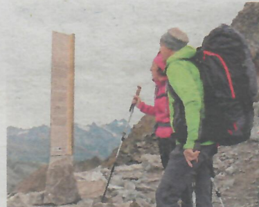
Über 20.000 Bergliebhaber verwirklichen die Alpenüberquerung.

mit den Partnern aus Südtirol die vergessene Originalroute im Ötztal wieder vermehrt in den Fokus rücken. Nach dem „Ötzi“-Fund haben die Hüttenbetreiber und Tourenanbieter eine Alternativroute auf dem neu errichteten Weg vom Tiefenbachgletscher über Vent ins Schnalstal promotet. Die Tour führt an der Fundstelle vorbei