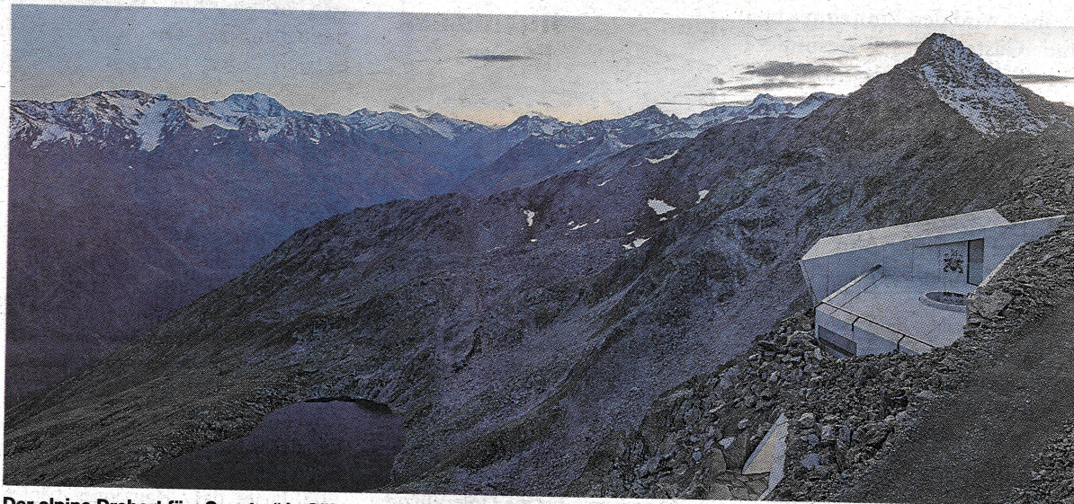
Der alpine Drehort für „Spectre“ in Sölden fasziniert mit einmaligen Ausblicken.

Spannende Verfolgungsjagden, exklusive Fahrzeuge und Hightech-Gadgets: James Bond begeistert seit 60 Jahren weltweit. Am Original-Drehort von „Spectre“ entführt 007 ELEMENTS in die Welt des Leinwandhelden. Das einmalige Bergpanorama und Genuss auf höchstem Niveau im Gourmetrestaurant ice Q runden das Gesamterlebnis auf 3.040 Metern Höhe ab.