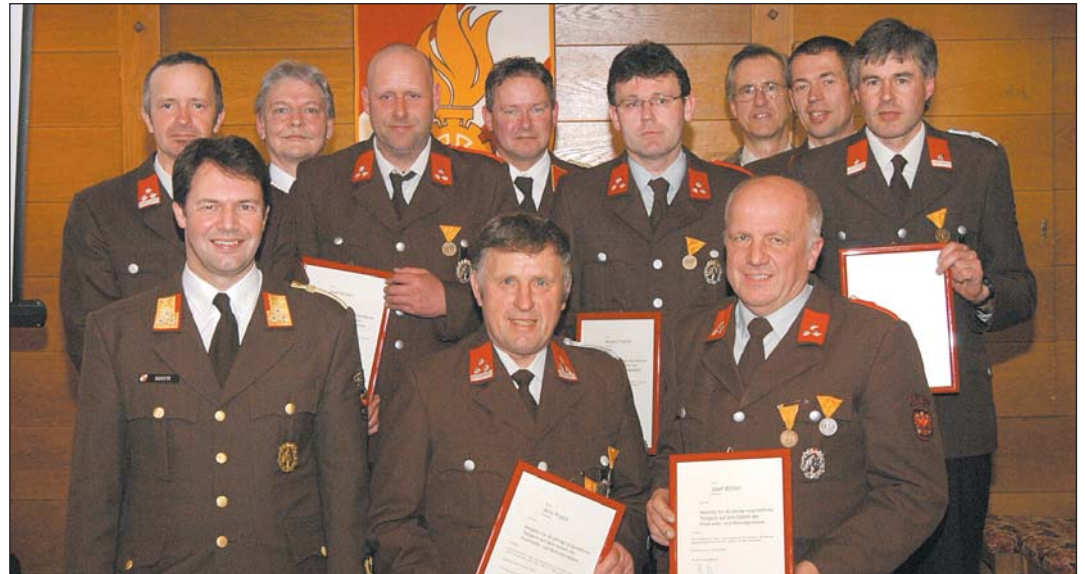
Die ausgezeichneten Schwoicher Feuerwehrmänner im Kreis der Ehrengäste.