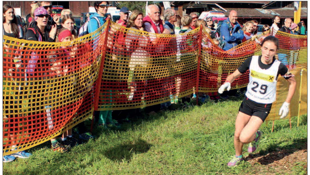
Der große TirolMilch Cup Sommer-Biathlon lockte 137 Nachwuchs-Athleten nach Schwoich.

Das Projekt soll auch im Rahmen der neu entstehenden LEADER-Region zur Förderung eingereicht werden. Wir werden über die weitere Entwicklung berichten.