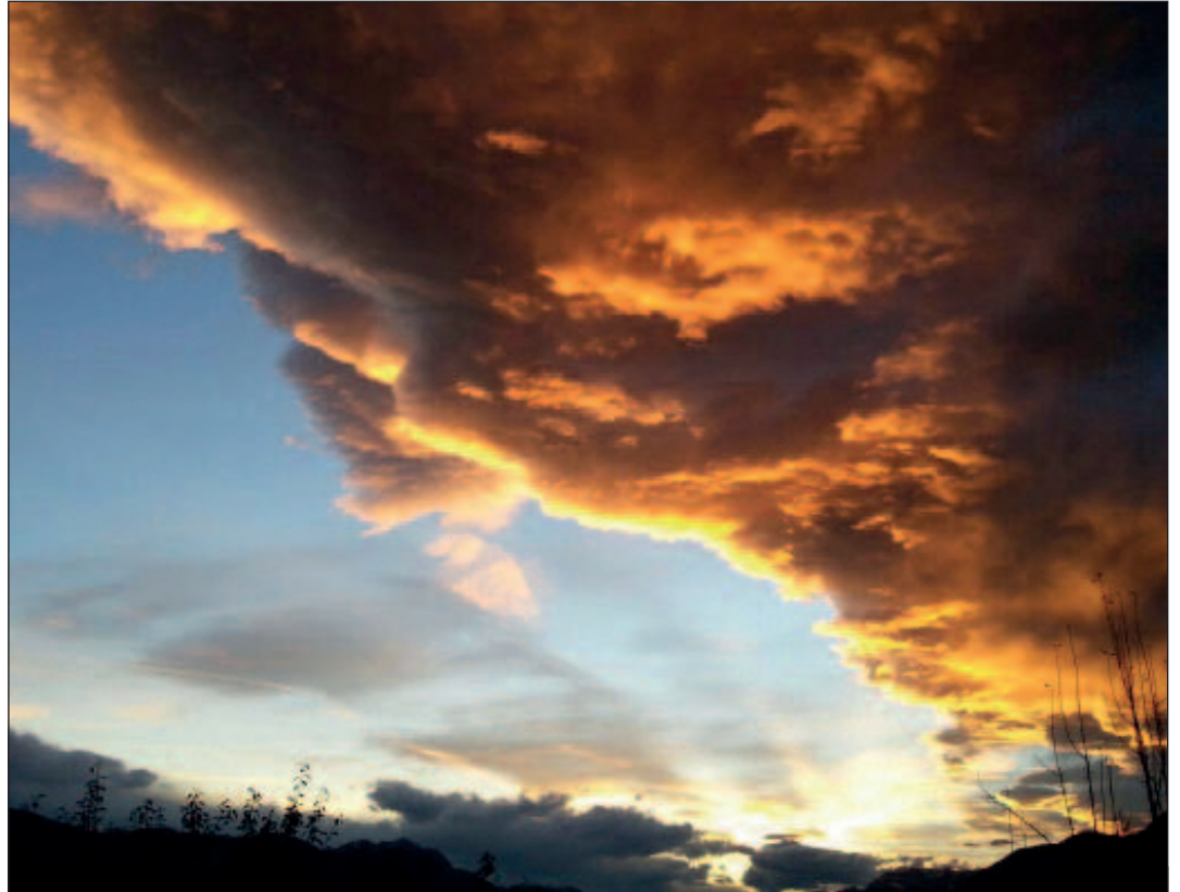
ALS WÜRDE DER HIMMEL BRENNEN – gespenstisch schön präsentierte sich die Wolkendecke am späten Nachmittag des 11. November über Schwoich.