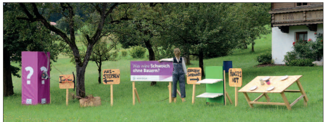
Die Schwoicher Landjugend will mit dieser Darstellung zum Nachdenken anregen.

„Unsere ersten Einfälle waren: Keine Milch, kein Fleisch, kein Getreide. Doch nach längerer Diskussion wurde uns klar, dass mit diesem Thema noch viel mehr in Verbindung steht: Dass es ohne Bauern keinen Tourismus, keine Skipisten und keine Almen geben würde. Dass auch unsere schöne Kulturlandschaft, auf die wir Tiroler besonders stolz sind, nicht mehr das wäre, was sie ist. Dass regionale Produkte aus den Kühlschränken verschwinden und nur noch Produkte aus Übersee zu finden wären, die künstlich und in