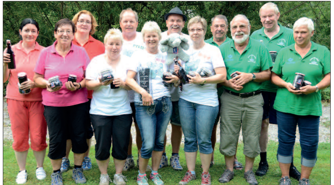
Die drei bestplatzierten Moarschaften der Moosbeer-Trophy 2015.

band die abschließende Preisverteilung auch heuer wieder mit einer sozialen Aktion: Der Reinerlös einer Moosbeer-Versteigerung wird wieder für einen guten Zweck gespendet.