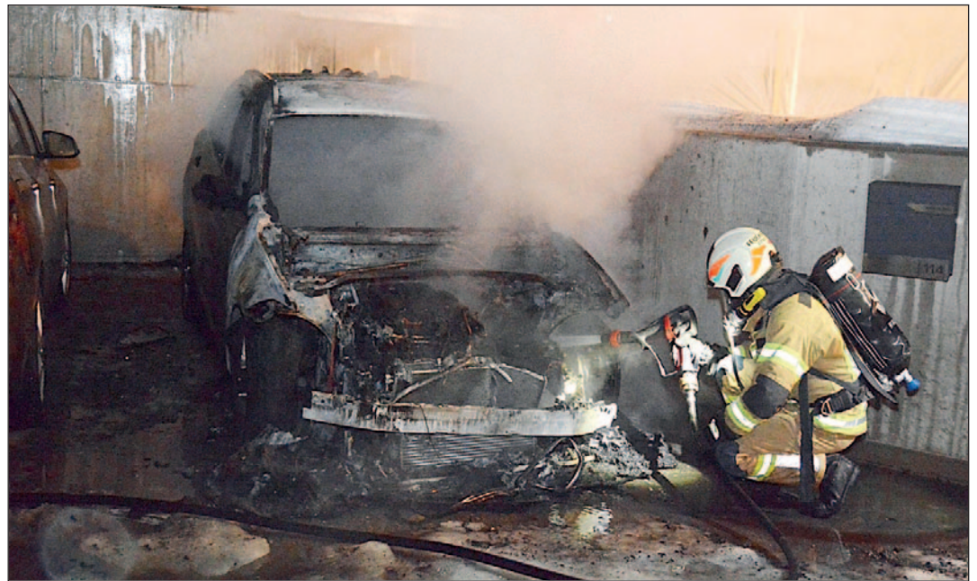
Ein brennendes Auto vor einem Einfamilienhaus in Schwoich „Am Bach“! Durch den raschen Einsatz der Schwoicher Feuerwehr konnte in der Nacht zum 12. Dezember ein Übergreifen des Feuers auf das Wohnhaus verhindert werden. Wie sich herausstellte, war der Brand gelegt worden!