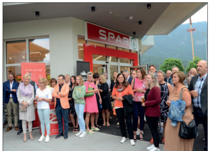
Über 150 Gäste waren gekommen, um das neue SPAR-Geschäft in Augenschein zu nehmen.