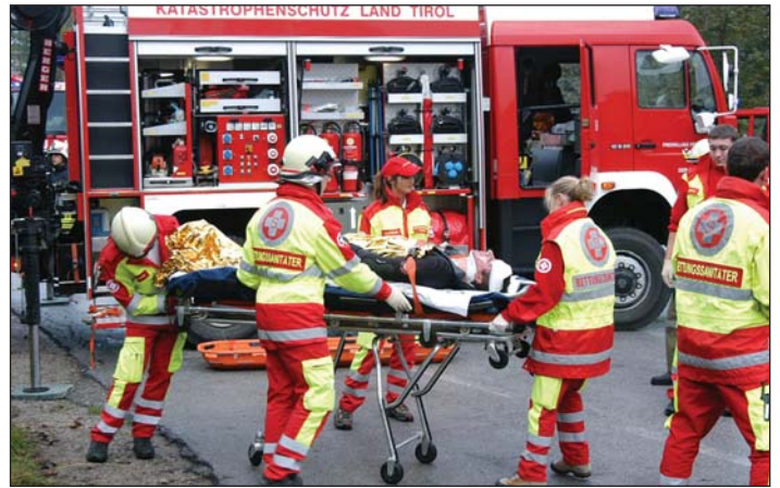
Über 400 Helfer waren bei der Großübung im SPZ Zementwerk Eiberg im Einsatz.

Großeinsatz für die Rettungskräfte im Tiroler Unterland: Verkehrsunfälle, Brände, Explosionen, ein Strahlenschutzsinsatz – beim großen Bezirksübungstag am 10. Oktober hatten Florianijünger und Rettungsdienste alle Hände voll zu tun. Das SPZ Zementwerk Eiberg an der Grenze zwischen Schwoich und Söll diente als Übungsgelände für 31 Feuerwehren aus dem Bezirk Kufstein, die im Rahmen der Übung von Rotem Kreuz und Samariterbund unterstützt wurden. Rund 400 Helfer sahen