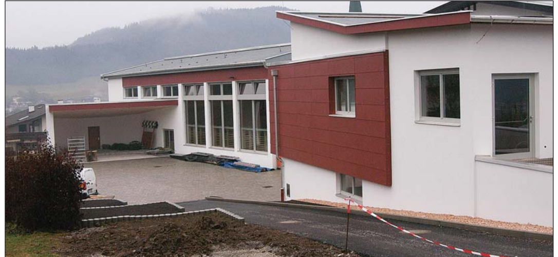
Der Umbau im Bereich des Schulhauses ist fast abgeschlossen und wird 2010 fertiggestellt.

270.300 Euro in den Abwasserverband fließen aus Schwoich 111.300 Euro. Die Kosten für die Wasserversorgung sinken allerdings von 114.300 auf 86.100 Euro. Für die Müllbeseitigung muss die Gemeinde € 94.200 aufbringen. Außerdem bezahlt Schwoich € 83.800 für die Haupt- und € 48.900 für die Musikschule.