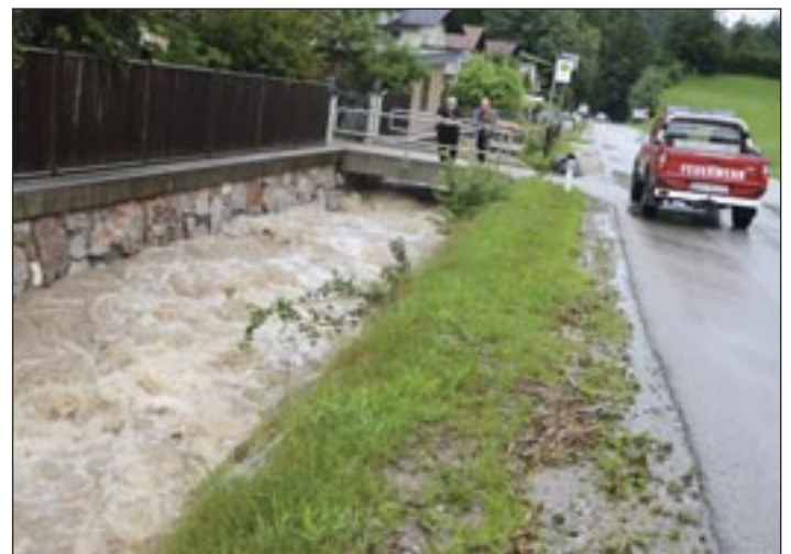
Bewährt hat sich die Bachverbauung oberhalb der Schwoicher Brücke.