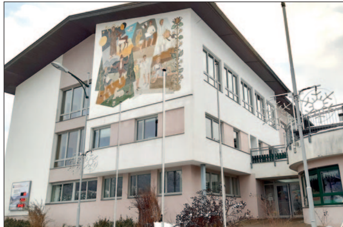
Die Sanierung und Modernisierung unseres Volksschul-Gebäudes wird die Gemeinde in den nächsten Jahren intensiv beschäftigen.

Die Liste der Vorhaben ist lang, und der Budgetrahmen für 2022 ist bereits ausgearbeitet und soll dann vom neu gewählten Gemeinderat umgesetzt werden. Das Budget der Gemeinde weist einen Haushalt von 8,650.000 Euro an Einnahmen und Ausgaben aus. Bgm. Peter Payr hat für das „Forum“ die Schwerpunkte der Ge-