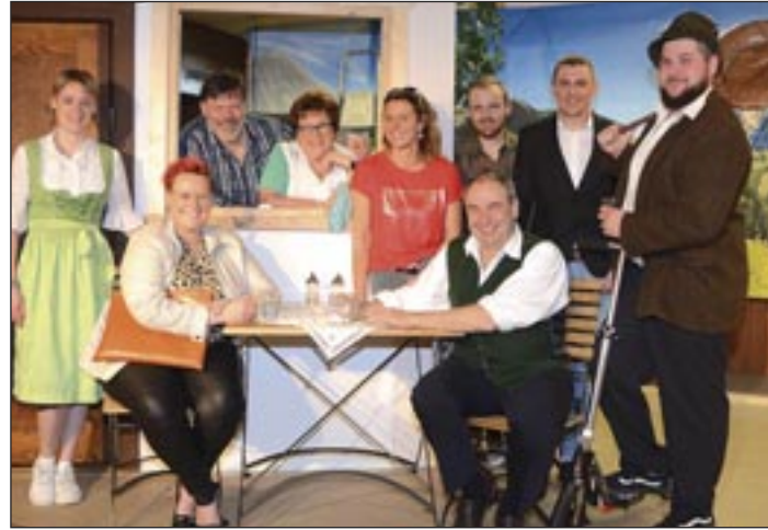
Das aktuelle Ensemble der Schwoicher Theaterrunde.

Isolde Brammler ist von der Stadt in ein kleines Bauernhaus gezogen – direkt gegenüber dem Landgasthaus von Martin Gamsreiter. Schnell gibt's die ersten Probleme: Der morgendliche Hahnenschrei, die Glocken der nahegelegenen Kirche, die Küchengerüche aus dem Gasthaus – alles ist der zickigen Nachbarin ein Dorn im Auge. Es gibt jede Menge Ärger, und so will der schlitzohrige Messner Abhilfe