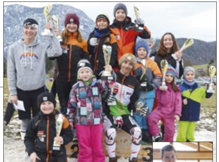
Bild rechts: Die alpinen Vereinsmeister in der Kinder- und Schülerklasse.