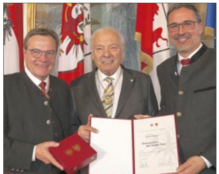
LH Günther Platter und sein Südtiroler Amtskollege Arno Kompatscher überreichten das Ehrenzeichen an Komm.-Rat Helmut Bodner.

planten Baurestmassen-Deponien in Schwoich und Kufstein. Im Schreiben wird der Bundesgesetzgeber u. a. aufgefordert, Deponien mit Gefahrenstoffen in direkter Nachbarschaft von Siedlungsgebieten, Gesundheits-, Erholungs- und Bildungseinrichtungen und landwirtschaftlichen Nutzbetrieben gänzlich zu verbieten.