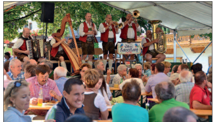
Der Kaiserklang sorgte für beste Stimmung auf der Kirchgasse.