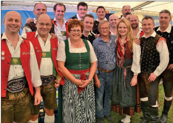
Die Oberkrainer aus Begunje und der „Ebbser Kaiserklang“ unterhielten die Besucher beim Jubiläums-Hoffest in Schwoich..

Feiern für einen guten Zweck: Das traditionelle Hoffest beim „Veiten“ in Schwoich fand heuer zum 10. Mal statt. Und zum Jubiläum ging das Fest sogar über zwei Tage. Auftakt für das Jubiläumsfest war am 10. September ein ganz be-