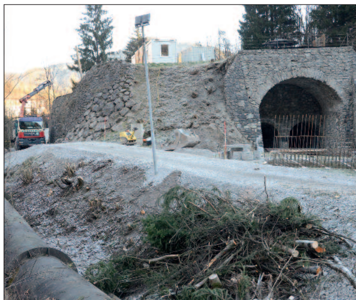
An der Schwoicher Brücke wird ein Teilstück des Radweges zwischen Söll und Kufstein auf Schwoicher Gemeindegebiet ausgebaut.

Auch zwischen Söll und Kufstein wird ein neuer Radweg angelegt. An der Schwoicher Brücke wird zur Zeit ein Teilstück dieses Radweges ausgebaut. Der Abschnitt auf Schwoicher Gemeindegebiet ist rund 150 Meter lang, die Arbeiten dafür werden im kommenden