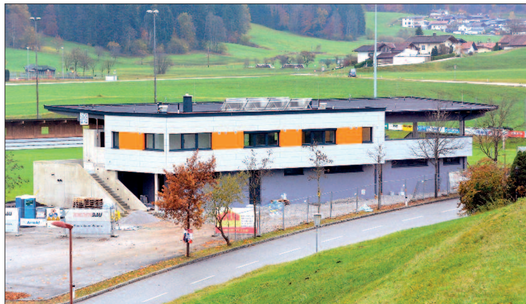
Im Frühjahr 2017 wird das neue Kabinengebäude des FC Schwoich eröffnet.

Der große Bereich „Gesundheit“ geht ordentlich ins Geld: 2017 steuert Schwoich €147.000 für den Betriebsaufwand des BKH Kufstein bei, €348.400 fließen in den Tiroler Gesundheitsfonds. Behinderten- und Sozialhilfebeitrag summieren sich auf €267.400 und die Jugendwohlfahrt auf €39.500. Rettung und Notarzt schlagen mit insgesamt €20.900 zu Buche, der