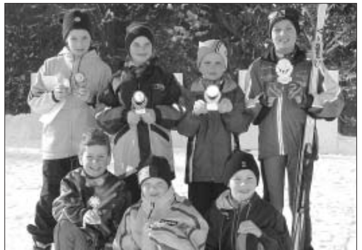
Gut „in Schuss“: Im Bild der erfolgreiche Biathlon-Nachwuchs des WSV Schwoich.