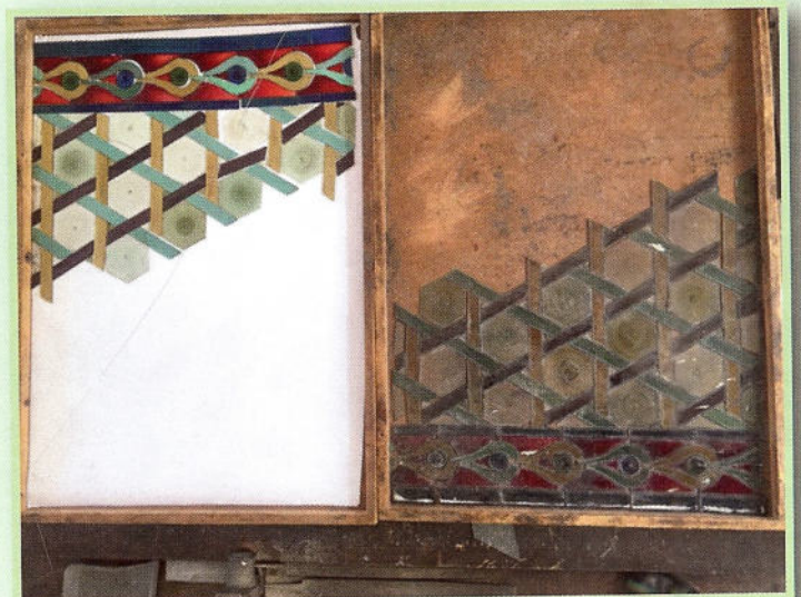
links: bereits gereinigte und zerlegte Bleiverglasung mit Transportsicherung der Bleiverglasung rechts: restliches Fenster noch vor dem Zerlegen

Zur Sanierung wurde die Firma Tiroler Glasmalerei beauftragt. Die am stärksten beschädigten Fenster müssen ausgebaut werden, in der Werkstätte zerlegt und wieder neu aufgebaut werden. Mittlerweile ist bereits das erste Fenster ausgebaut und befindet sich bereits in der Werkstätte der Tiroler Glasmalerei.