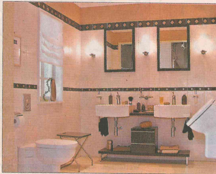
Reizvoll und elegant: Die Bäder bei der Firma Schneider überzeugen durch innovatives Design.

Die Firma kann aber auch mit einer Besonderheit aufwarten: dem exklusiven Schauraum der Weltmarke Villeroy und Boch, das „House of Villeroy und Boch“, dem ersten und bislang einzigen in Tirol. Es bietet ein ganzes Haus voller attraktiver Anregungen für ein schönes Zuhause: Fliesen und Badausstattungen