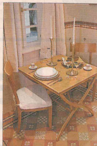
Das „House of Villeroy und Boch“ bietet Wohnideen vom Bad bis zur Küche.