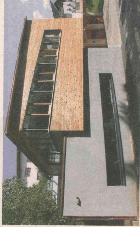
Holz - der Baustoff macht den Anbau freundlich und warm.

Das wesentliche Ziel war die Erstellung einer Gesamtstruktur unter Einbeziehung des Bestandes und dessen Erschließungswege. Dem Altbestand wurde eine leichte Holzkonstruktion gegenübergestellt. Das damit zwischen neu entstandene Foyer ist eine harmonische Verbindung