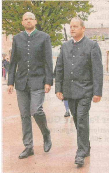
Abschreiten der Front, eine alte Tradition bei Festakten.

wurden Energieleitungen, Lichtwellenleiter und Wasserleitungen erneuert und ergänzt. Der neue Brunnen aus Buch ist zwischen zwei Parkbänken und dem Grünbereich positioniert. Die Oberfläche der Fahrbahn wurde in einem leicht rötlichen Ton gestaltet. Umrahmt wurde die Feier durch Ehrungen an verdiente langjährige Mitarbeiter:innen der Gemeinde. Und als „Entschädigung“ für die Entbehrungen während der Bautätigkeiten wurden alle Anrainer:innen zum Essen geladen. (dw)