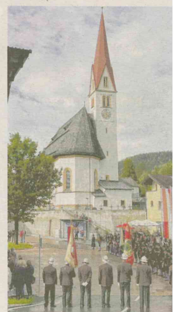
Alle Traditionsvereine waren zur Dorfplatzweihe angetreten.