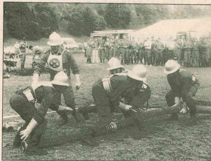
Bei diesem Wettbewerb kommt es auf Schnelligkeit und Technik an