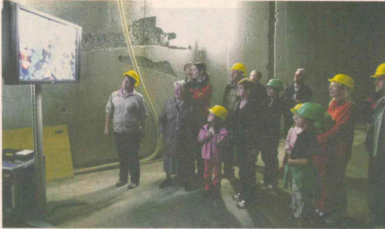
Großes Interesse herrschte unter Tag, als die Fachleute den vielen Besuchern den Fortschritt der Arbeiten näherbrachten.