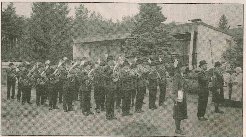
Die Musikkapelle Terfens sorate für festliche Umrahmung.