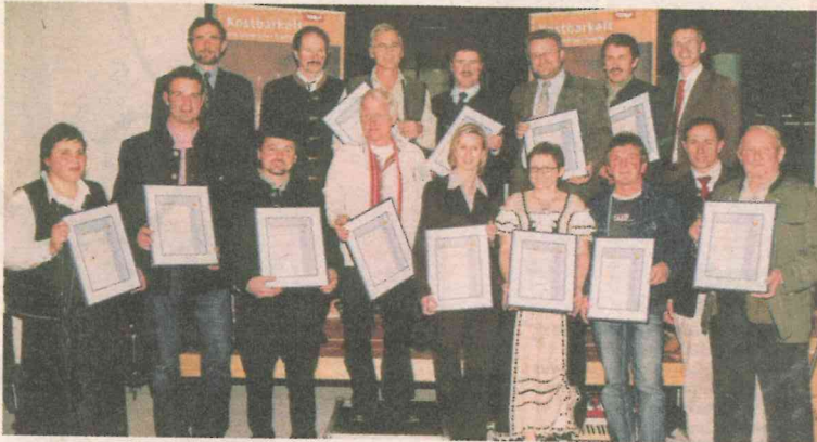
Die ausgezeichneten Brenner aus dem Bezirk Schwaz