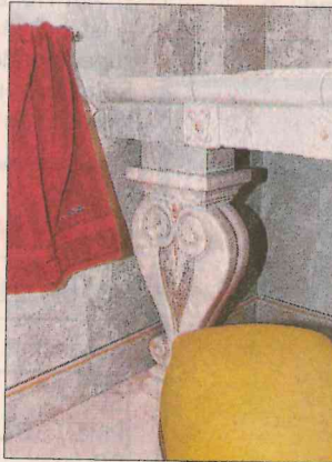
Qualitätskriterium: die Genauigkeit der Arbeit.

notwendig ist.“ Beide Verfahren benötigen spezielles Wissen und genaueste Arbeit. Schneider: „Nur dann hat man mit seinen Fliesen viele Jahre keinerlei Probleme.“