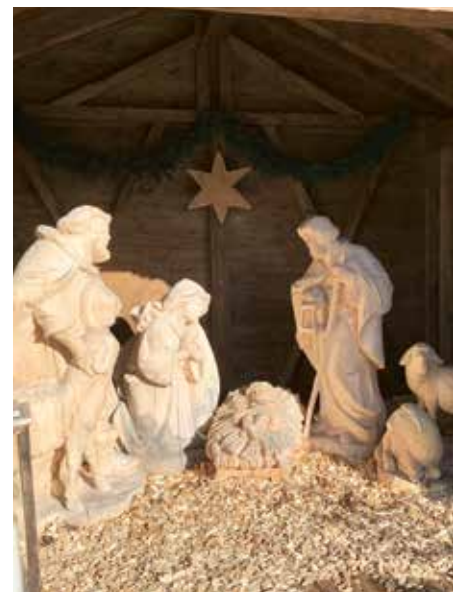
Krippe am Häusererbüchel in Maurach.

Auch heuer erstrahlt die Krippe am Häusererbüchel in Maurach am Achensee wieder im weihnachtlichen Glanz!