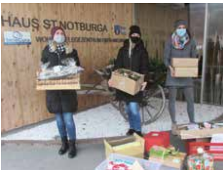
Ein Adventkalender befüllt mit vielen tollen Geschenken vom Katholischen Familienverband Maurach.