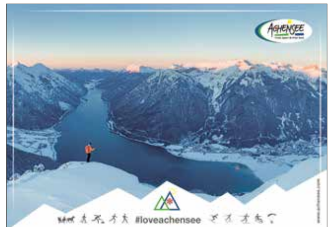
Werbesujet Sanfter Winter am Achensee

Gestartet wird im Jänner 2021 mit verschiedenen Maßnahmen: TV-Einschaltungen im ORF (Bundesland heute/Oberösterreich und Wien) sowie auf RTL Österreich, Printanzeigen in qualitativ hochwertigen Medien (GEO Schweiz, Die Presse, Oberösterreichische Nachrichten etc.) sowie umfangreiches Online-Marketing.