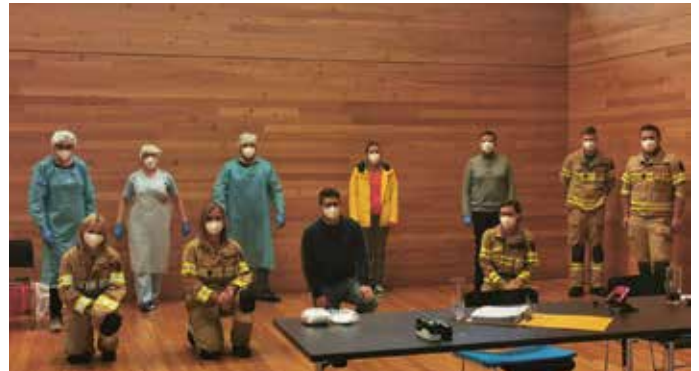
Freiwillige Helfer bei „Tirol testet“ in Steinberg.