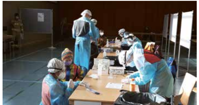
Klappte wie am Schnürchen: Corona-Massentest in Achenkirch.