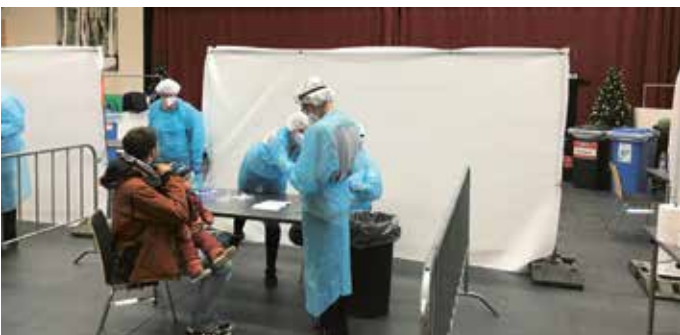
Auch in der Gemeinde Eben wurde fleißig getestet.

In nur kürzester Zeit musste auch die Gemeinde Eben am Achensee ärztliches Fachpersonal und freiwillige Helfer für die Corona-Massentests von 4. bis 6. Dezember 2020 finden. Pro Testtag waren 15 Personen im Einsatz, darunter auch die Freiwillige Feuerwehr und die Schützenkompanie Eben-Maurach. Im Gemeindezentrum wurden drei Teststraßen eingerichtet. Von den insgesamt 3.842 zur Testung zugelassenen Bewohnern der Gemeinde Eben am Achensee ließen sich 1.082 Personen testen. Fünf von ihnen erhielten ein positives Ergebnis.