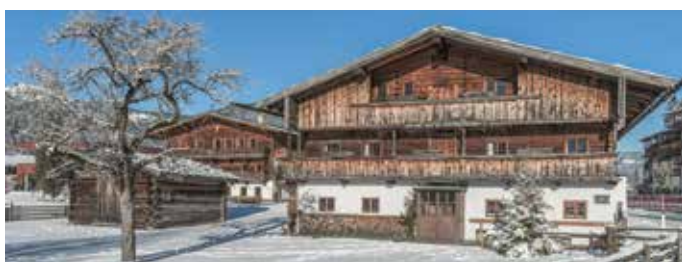
Heimatmuseum Sixenhof in Achenkirch

Die „ruhigen“ Zeiten beider Lockdowns wurden für Umgestaltungen genutzt. Angeregt von Expertinnen der Kulturabteilung des Landes Tirol und des ICOM (International Council of Museums) wurden viele Exponate, die im Museum mehrfach vorhanden waren, in das Depot Schweinau gebracht, das die Gemeinde dem Verein zur Verfügung gestellt hat. Einige Objekte wurden innerhalb des Hauses thematisch zusammengeführt. Auch die Beschilderung musste teilweise erneuert werden. Im ersten Obergeschoß wurden drei Räume neu eingerichtet. So gibt es erstmals eine Dokumentation von der Entstehung der zwei Pionierbetriebe „Rainers Seehof“ und „Zur Scholastika“. Diese Arbeiten wurden überwiegend und dankenswerterweise von Maria & Hermann Jaud durchgeführt.