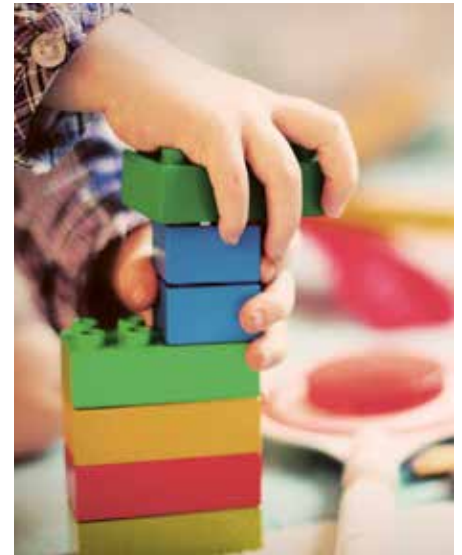
Top-Kleinkindbetreuung in Eben.

Kinderkrippe „Butterblumenkinder“ für ihre hervorragende Arbeit sowie bei den 81 Eltern, die an der Umfrage teilgenommen haben, was einer Rücklaufquote von 62 % entsprach.“ Der Kindergarten Pertisau hat eine andere Form der Umfrage gewählt. Das Gesamtergebnis der Befragung ist online auf der Homepage der Gemeinde Eben unter www.eben.tirol.gv.at abrufbar.