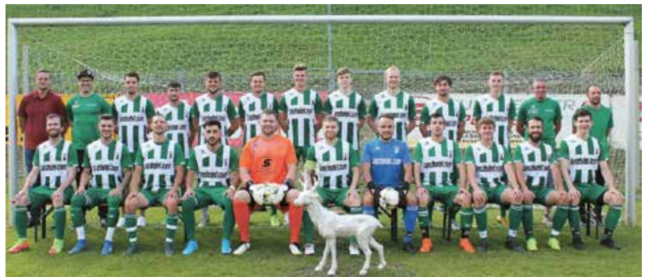
Aufgestellt: Der SV Achenkirch möchte 2021 wieder voll angreifen.