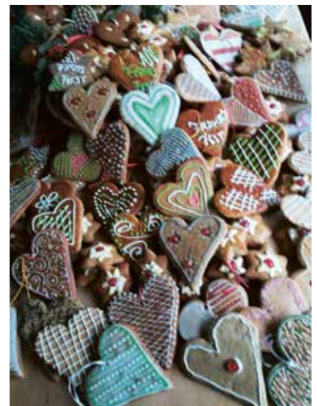
Verzierte Lebkuchen der Freiwilligengruppe.

Die Steinberger Haushalte erhielten heuer eine besondere und eine besonders köstliche Weihnachtspost. Im Weihnachtsgruß der Gemeinde war nämlich auch Süßes dabei. Zehn Frauen der Freiwilligengruppe Steinberg haben über 200 weihnachtliche Lebkuchen gebacken, diese kreativ verziert und für den Gruß der Gemeinde zur Verfügung gestellt. Dafür gebührt ihnen ein großes Dankeschön. Wir hoffen, die Lebkuchen haben geschmeckt und gerade in der heurigen Vorweihnachtszeit auch ein Gefühl von Wärme und Nächstenliebe erzeugt.