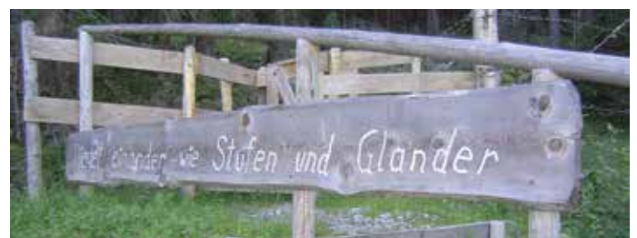
„Dienet einander wie Stufen und Glander“