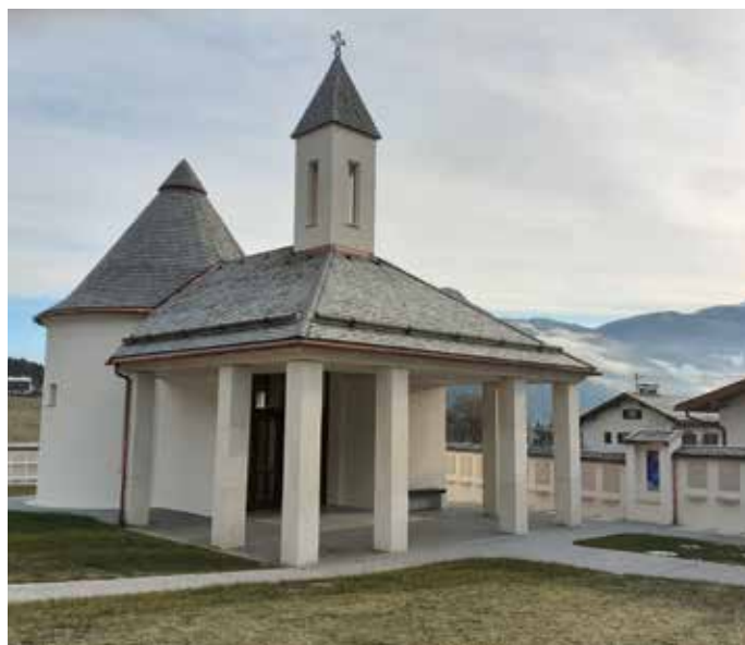
Die neue Aufbahrungshalle wurde durch einen überdachten Vorplatz ergänzt.