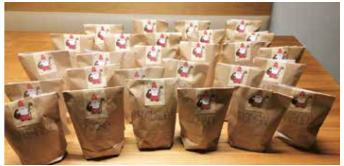
Selbstgebastelte und befüllte „Nikolaussackerln“ der LJ Steinberg.

Weil der Nikolaus dieses Jahr leider nicht vorbeikommen konnte, eilte die Landjugend Steinberg zur Stelle, um unsere Kinder zu überraschen. So fanden diese am 6. Dezember 2020 vor ihrer Haustür ein mit Süßigkeiten gefülltes Sackerl und einen persönlich geschriebenen Brief vom Nikolaus. Nicht nur die Kleinen, auch ihre Eltern waren begeistert, wie viel Herzblut und Engagement die Jungbauern in diese Aktion gesteckt haben. Ein herzliches Dankeschön an die Landjugend Steinberg.