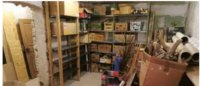
Das Werkslager der Achentaler Krippenfreunde.