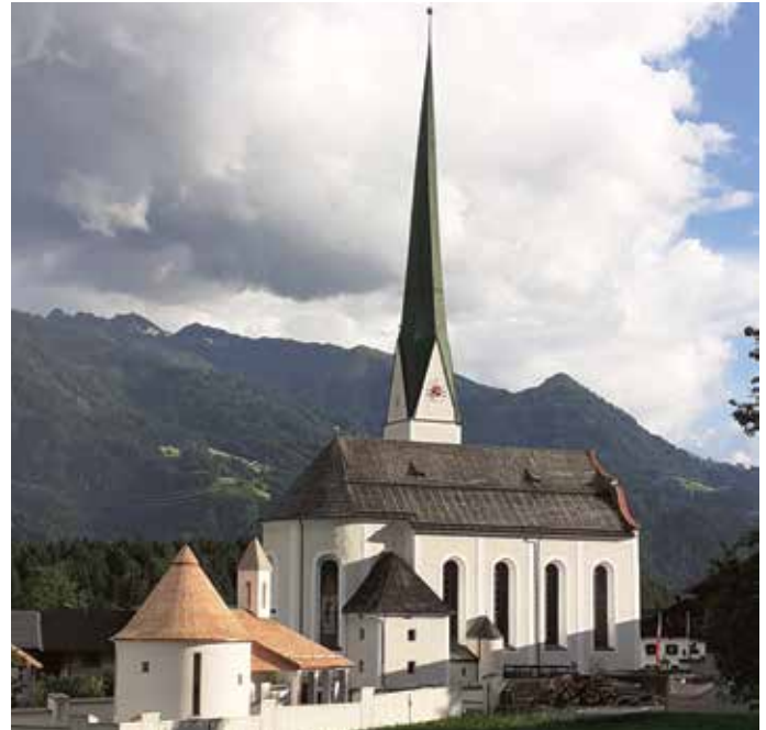
Neue Aufbahrungshalle in Wiesing.