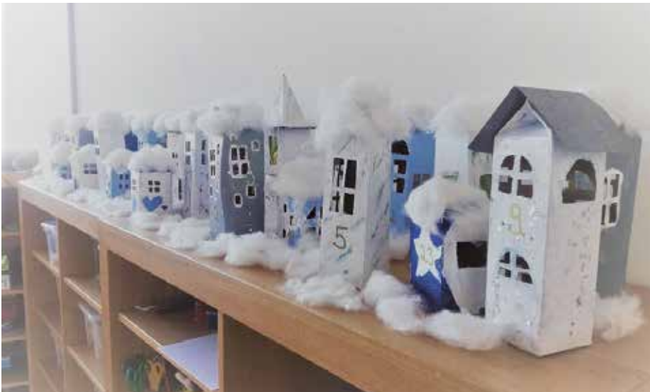
Selbstgebastelte Adventkalenderstadt im Hort in Achenkirch

Trotz Corona kam in der Vorweihnachtszeit im Hort in Achenkirch auch immer wieder Freude auf, unter anderem über einen überraschenden Brief des Wichtels Baltasar. „Ich bin der Wichtel Baltasar und kommen tu ich jedes Jahr! Ich schau, was die Kinder hier so treiben und würde gerne länger bleiben“, so die ersten Zeilen im Brief des Heinzelmännchens. Die Hortkinder machten sich daraufhin sofort an die Sache und bastelten Baltasar ein Häuschen, das vor lauter Eifer sogar zum zweistöckigen „Wichtelpenthouse“ wurde, in dem sich der kleine Gast einquartierte und den Kindern so manchen Streich spielte. Besonders angetan war Baltasar auch von der im Hort gebastelten „Adventkalenderstadt“, die mit jedem Türchen, das geöffnet wurde, heller erstrahlte und somit besonders lichtvoll auf Weihnachten einstimmte.