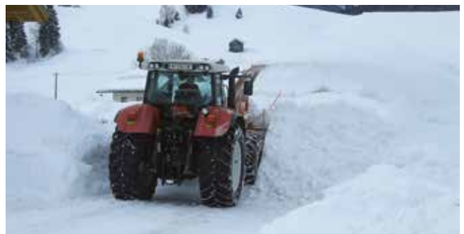
Die Schneeräumung in Achenkirch ist ein brisantes Thema.

„Die Schneeräumung stellt jedes Jahr eine besondere Herausforderung für unsere Bauhofmitarbeiter dar“, appelliert Bauhofleiter Hubert Rainer an die Vernunft der Bevölkerung und bittet um Mithilfe. Insbesondere die Räumung der Gehsteige werde von Jahr zu Jahr schwieriger, da sich die Ablagerungsflächen durch die immer dichter werdende Verbauung stark reduzieren. „Natürlich ist auch die Ablagerung des Schnees durch Privatpersonen auf den öffentlichen Verkehrsflächen ein großes Problem“, ergänzt Hubert Rainer. Speziell, wenn es nach der Räumung dieser Flächen durch die Gemeinde erfolge. Wir möchten daher an die gesetzlichen Bestimmungen der Straßenverkehrsordnung erinnern. Demnach haben Liegenschaftseigentümer im Ortsgebiet zwischen 6.00 und 22.00 Uhr Gehsteige entlang ihrer Liegenschaften zu räumen, was auch zutrifft, wenn kein Gehsteig vorhanden ist. In diesem Fall muss die Straße auf eine Breite von einem Meter geräumt und gestreut werden. Die Bevölkerung wird zudem erneut darum gebeten, keinen Schnee von Privatgrundstücken auf öffentlichen Verkehrsflächen abzulagern.