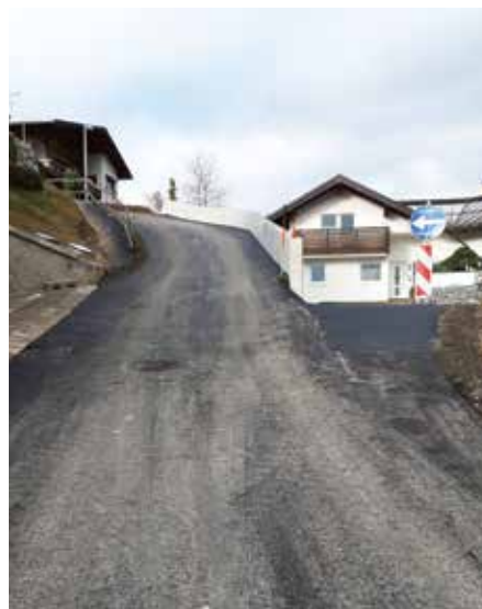
Fertiggestellt: Sanierungsarbeiten am „Formerbichl“.

die an den Sanierungsmaßnahmen beteiligt waren, im Besonderen jedoch an die Bewohner, für die diese Zeit mit erheblichen Einschränkungen verbunden war.