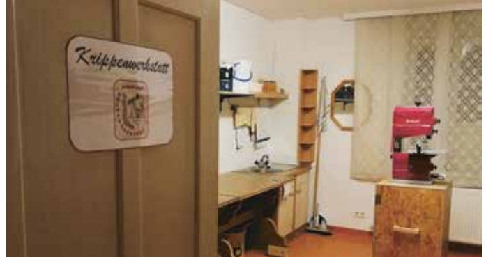
Die Krippenwerkstatt der Achentaler Krippenfreunde.