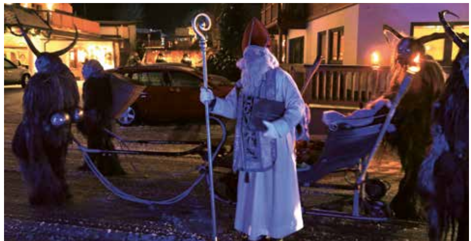
Der Heilige Nikolaus freute sich, dass er viele Kinder trotz Corona überraschen konnte.

den Nikolaus, die Krampusse und den Verein AHA für euer tolles Engagement!