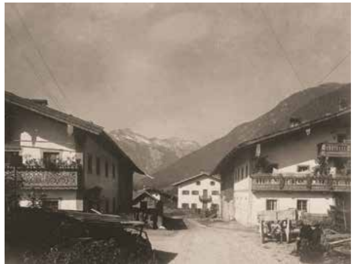
Häusern 1910: Im Vordergrund von links die Höfe Greil und Wach, hinten von links Rieder (Baumann) und Haberl (Neuhauser).

Während ich bei den ersten Gutsnamen sicher bin, habe ich bei den drei letztgenannten Gütern einfach den Versuch einer Erklärung gewagt, die noch auf sehr wackligen Beinen steht. Mit diesem wertvollen Dokument können wir jedenfalls wieder etwas „Licht“ in die Besiedlungsgeschichte unserer Gemeinde bringen. Chronik Eben - Johann Walser.