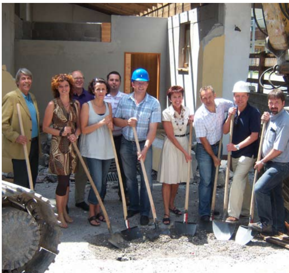
Am 25. Mai erfolgte der Spatenstich zum Um- und Zubau der Volksschule Wiesing. Im Bild sehen Sie den Bürgermeister mit dem Bauausschuss, dem Architekten- und Bauleitungsteam, sowie Vertreterinnen des Lehrkörpers Wiesing.