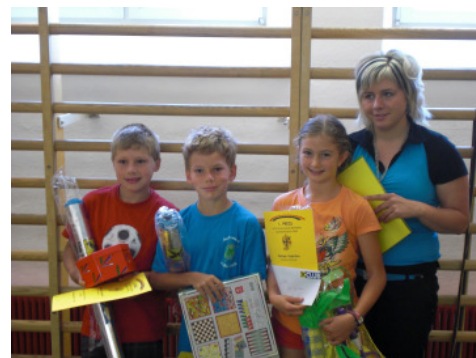
Gewinner 3./4. Klasse