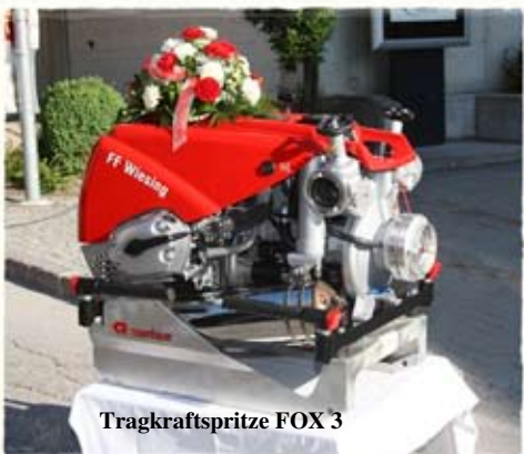
Tragkraftspritze FOX 3