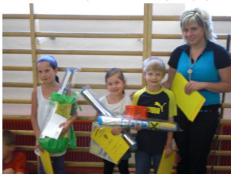
Gewinner 1./2. Klasse

Bei der Preisverteilung hatten die Kinder eine große Freude mit ihren von der Raiffeisenbank Jenbach-Wiesing zur Verfügung gestellten Preisen!