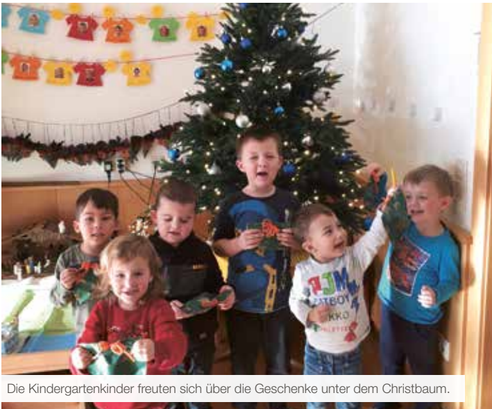
Die Kindergartenkinder freuten sich über die Geschenke unter dem Christbaum.