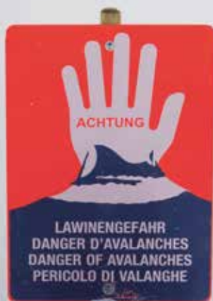
Lawinenkommissionen sind die Experten, wenn es um die Sicherheit in den winterlichen Bergen geht.

Das Gemeindegebiet wird in mehrere Teilbereiche aufgeteilt, für die jeweils Teilverantwortliche zuständig sind, d.h.: Festlegung der Beobachtungsgebiete und der dafür zuständigen Personen. In der Gemeinde Eben befinden sich zwölf Beobachtungsgebiete. Sollte in einem Teilbereich eine Sperre bzw. Öffnung notwendig sein, müssen mindestens vier Personen einen einstimmigen Beschluss fassen. Jeder Beschluss muss an den Vorsitzenden - sofern er nicht sowieso am Beschluss beteiligt ist - weitergeleitet und schriftlich festgehalten werden. Achenkirch ist in acht Beobachtungsgebiete unterteilt, Steinberg am Rofan in vier. Auch die Dokumentation ist ein wichtiger Aufgabenbereich der Lawinenkommission. Als Serviceleistung stellt die Gemeinde Eben am Achensee online unter www.lawinenkommission.at einen Lawinenlagebericht zur Verfügung, auf dem aktuelle Öffnungen/Sperren (Loipen, Straßen, Pisten usw.) abrufbar sind. Heini Moser, Vorsitzender der Lawinenkommission Eben am Achensee