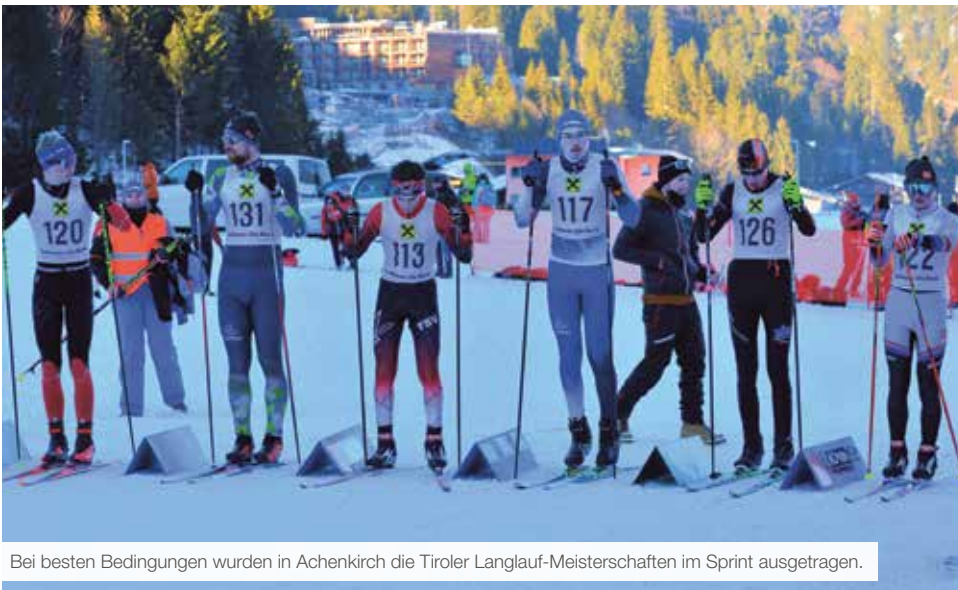
Bei besten Bedingungen wurden in Achenkirch die Tiroler Langlauf-Meisterschaften im Sprint ausgetragen.