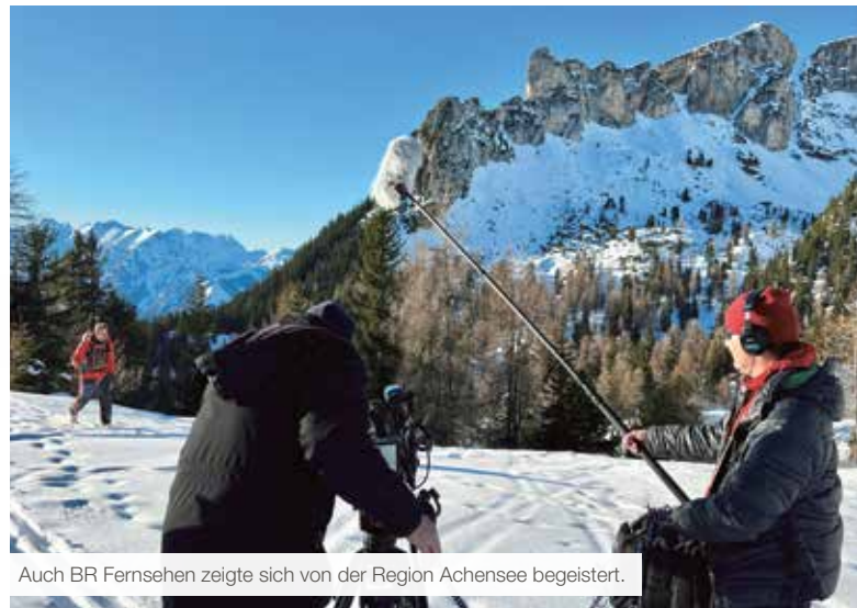
Auch BR Fernsehen zeigte sich von der Region Achensee begeistert.