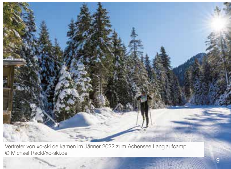
Vertreter von xc-ski.de kamen im Jänner 2022 zum Achensee Langlaufcamp.