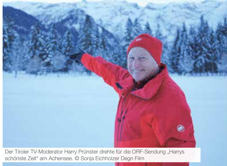
Der Tiroler TV-Moderator Harry Prünster drehte für die ORF-Sendung „Harrys schönste Zeit“ am Achensee.

Die spektakuläre Naturlandschaft ist eine Qualität der Achensee-Region, die außergewöhnlich gute Infrastruktur für Langläufer eine andere. Davon überzeugen konnten sich Vertreter des deutschen Skilanglauf-Portals xc-ski.de, die die Region im Rahmen eines Achensee-Langlaufcamps im Jänner 2022 besucht haben.