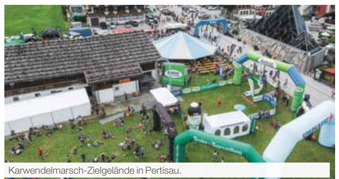
Karwendelmarsch-Zielgelände in Pertisau.