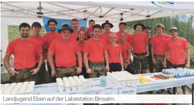
Landjugend Eben auf der Labestation Binsalm.

Danke allen freiwilligen Helfern und Einsatzkräften für eure großartige Unterstützung!