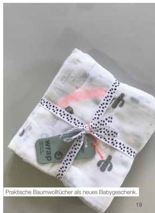
Praktische Baumwolltücher als neues Babygeschenk.

In diesem Jahr wurden in unserer Gemeinde bereits 27 Kinder geboren. Da wir uns über jeden neuen Mitbürger freuen, wird seinen Eltern seit vielen Jahren ein kleines Geschenk überreicht. Der Ausschuss für Gesundheit, Soziales, Bildung und Jugend hat sich dafür nunmehr etwas Neues überlegt. Die bisherige „Windeltorte“ wird durch zwei praktische Baumwolltücher (100% organic cotton) im Format 120 x 120 abgelöst. Diese sind umweltfreundlich (GOTS® zertifiziert) und können länger und vielseitig als Spuck-, Puck-, Musselin- oder Mulltücher genutzt werden. Alle frischgebackenen Eltern sind herzlich eingeladen, das Geschenk in der Gemeinde Eben am Achensee abzuholen. Die Meldung des Standesamtes an die Heimatgemeinde erfolgt automatisch, deshalb ist keine separate Anmeldung des Kindes in der Gemeinde mehr notwendig.