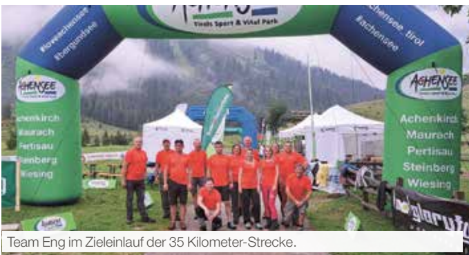
Team Eng im Zieleinlauf der 35 Kilometer-Strecke.