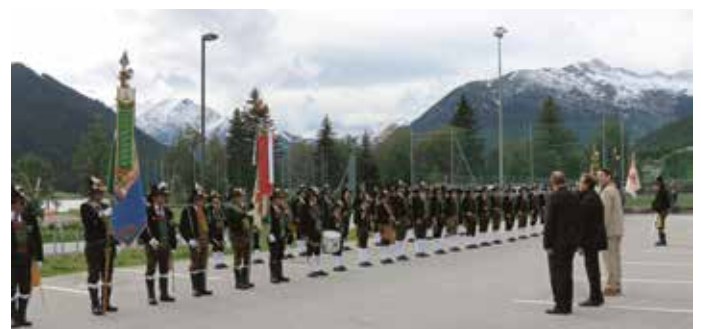
Schützenkompanien Eben-Maurach und Pertisau.