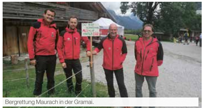
Bergrettung Maurach in der Gramai.