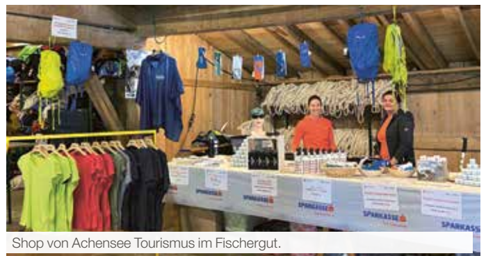
Shop von Achensee Tourismus im Fischergut.