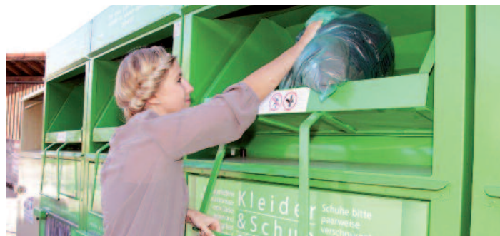
Die grünen Container für die Altkleidersammlung stehen bereit. Die Sammelsäcke gibt es kostenlos auf dem Recyclinghof oder beim Gemeindeamt.