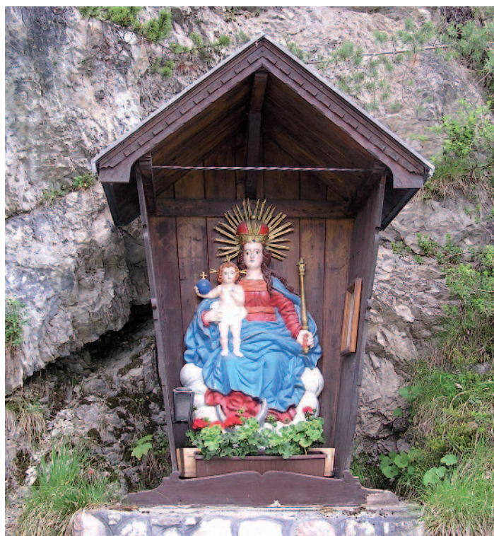
Die Gemeinde Eben und der Tourismusverband Achensee bedanken sich recht herzlich bei Hansjörg Lindner für die Betreuung des Bildstockes am Hechen-berg. 39 Jahre lang schmückte er die Muttergottes mit schönen Blumen. Auch an Reinhold Seidler richtet sich der Dank für die Blumenspenden.