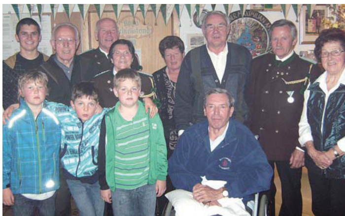
Preisverteilung Saisonmeisterschaft 2010/2011