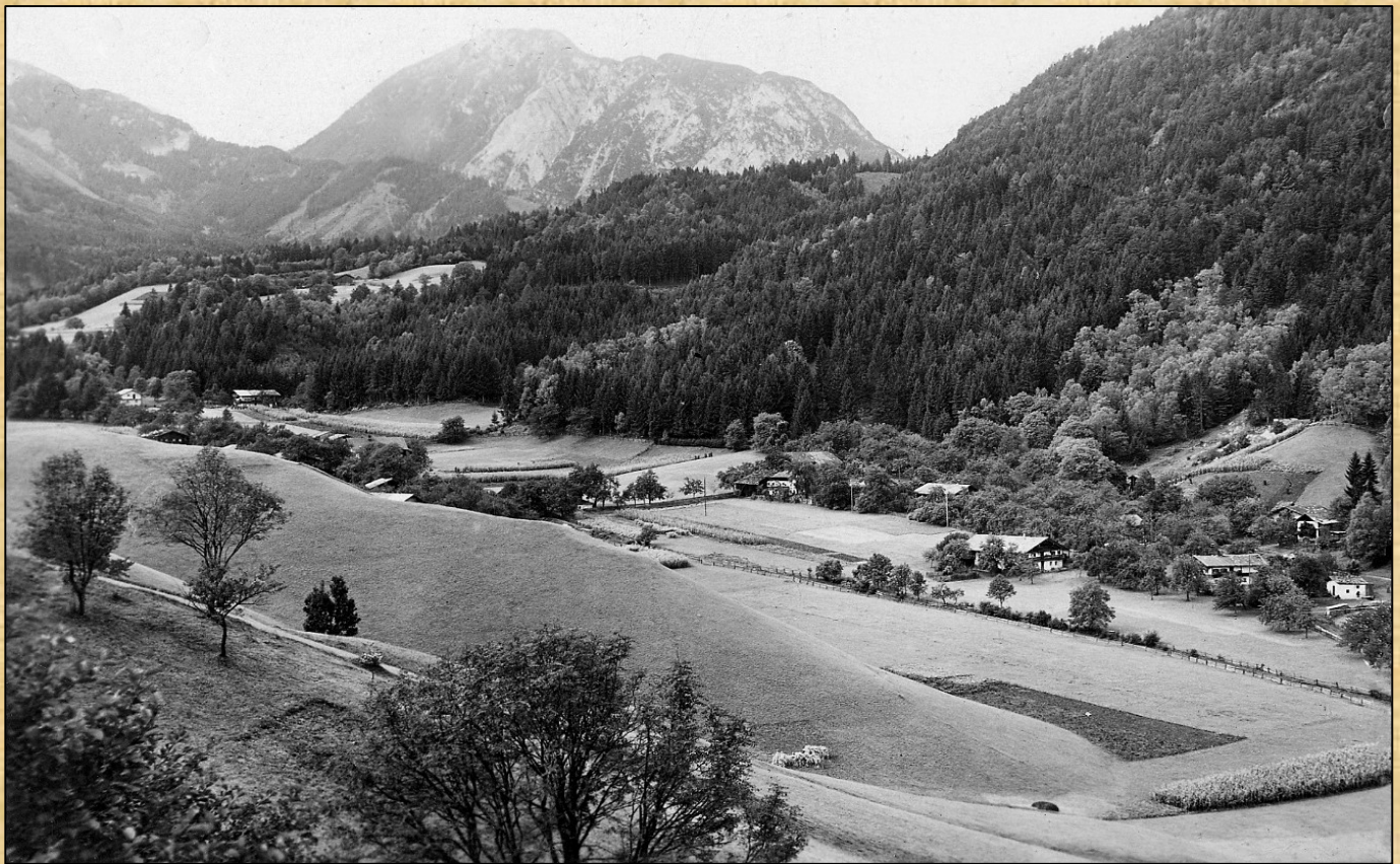
Blick auf Erlach 1937