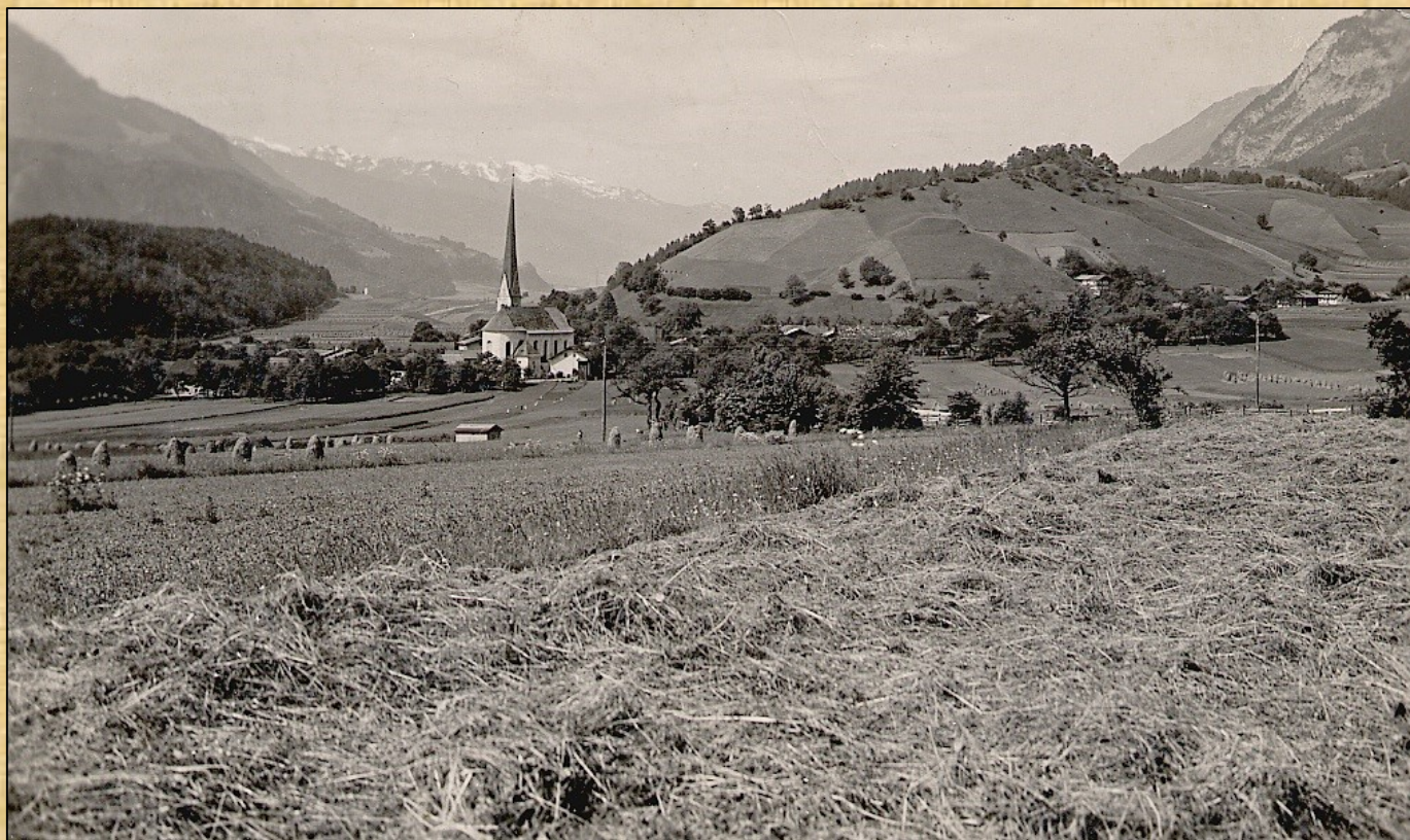
Blick vom „Woadgarten“ (heute Rofansiedlung) ins Dorf ca. 1940