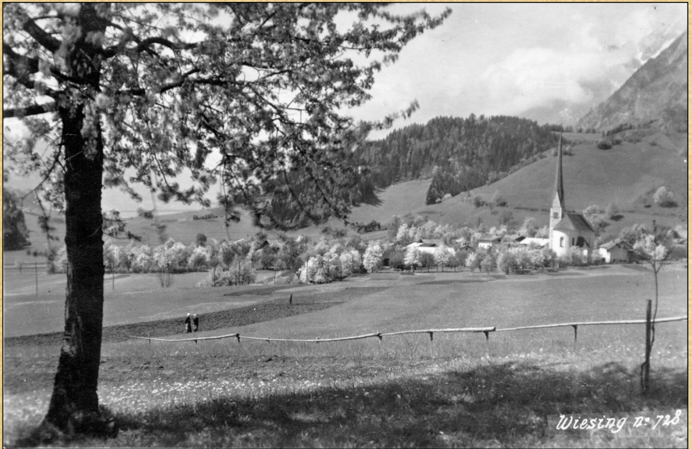
Blick von der Waldrüh ins Dorf ca. 1930