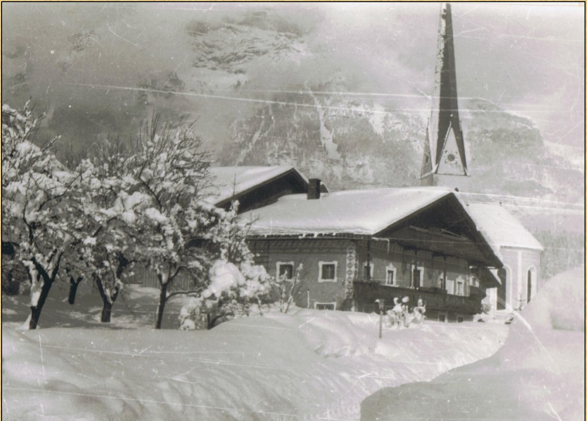
Lampfhof 1949 (heute Gemeindezentrum)