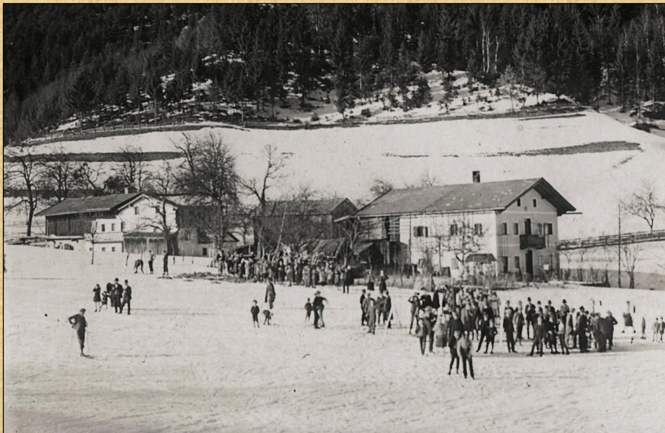
Winterspaß im Goreifeld ca. 1935 im Hintergrund die Häuser Mühle und Gorei