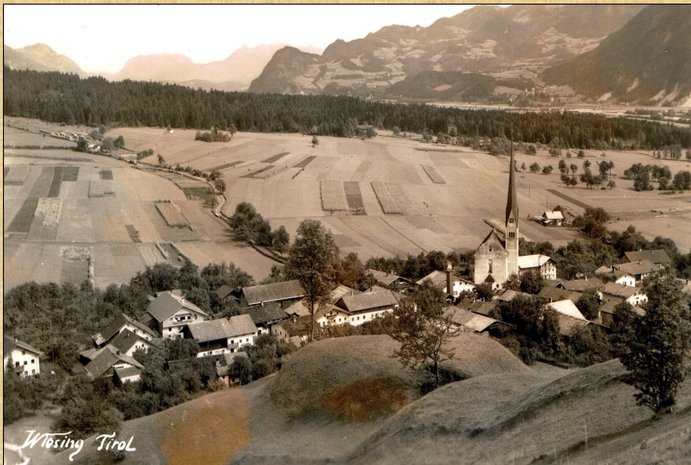
Blick vom Wiesinger Bühel ca. 1930