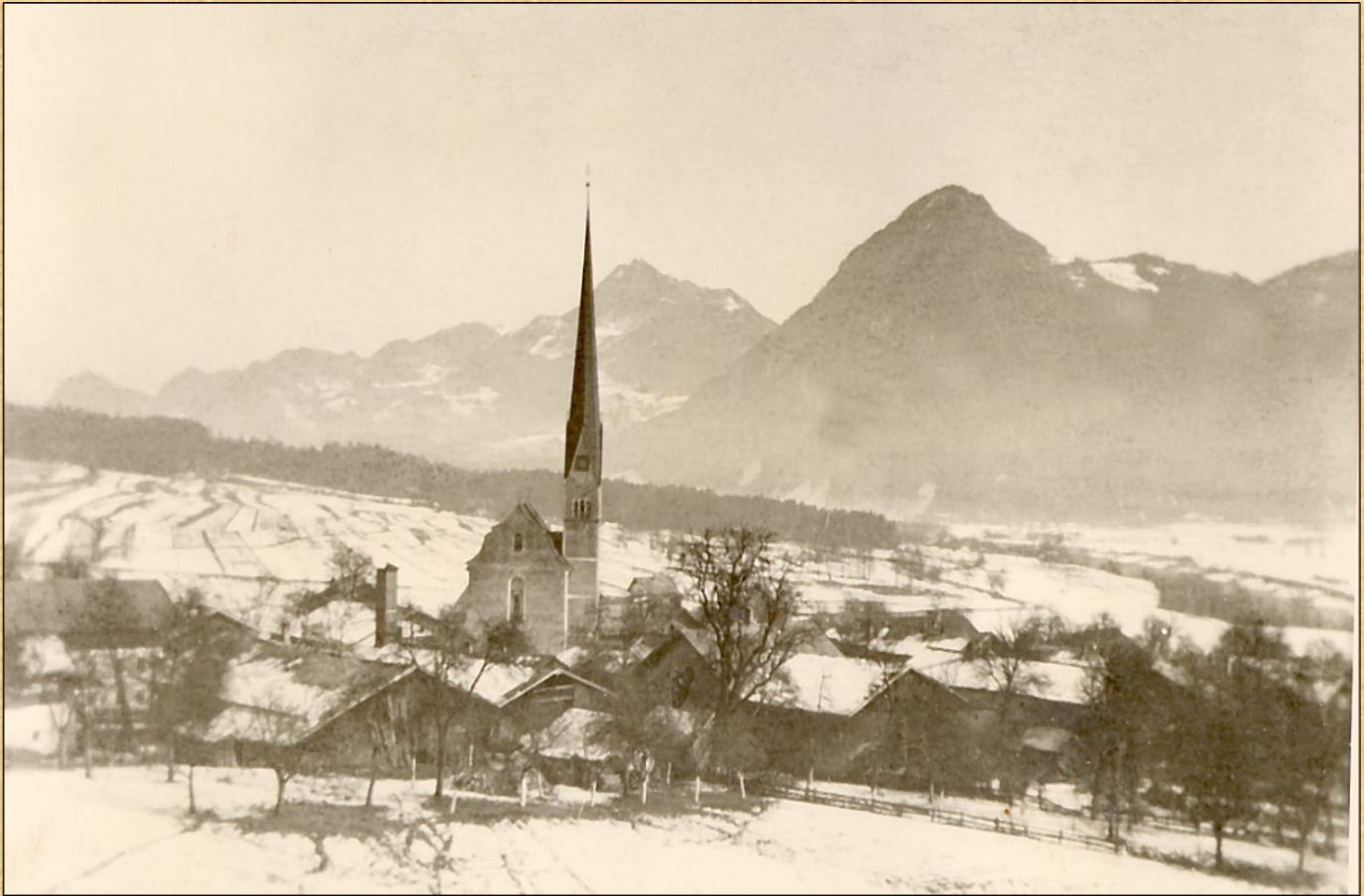
Frühling ca. 1930