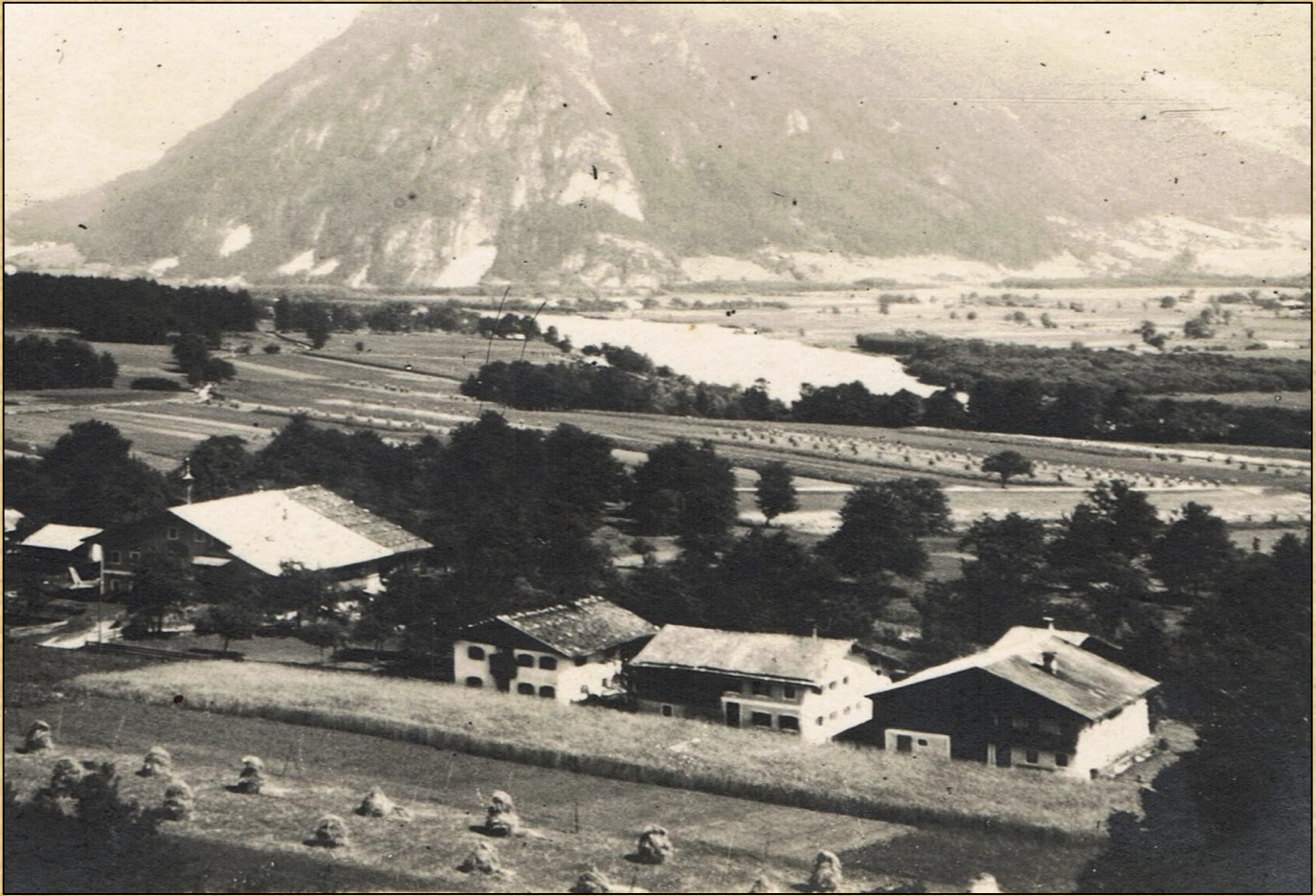
Die Höfe Jörgen, Deutschmann, Haring und Duning entlang der heutigen Dorfstraße ca. 1935