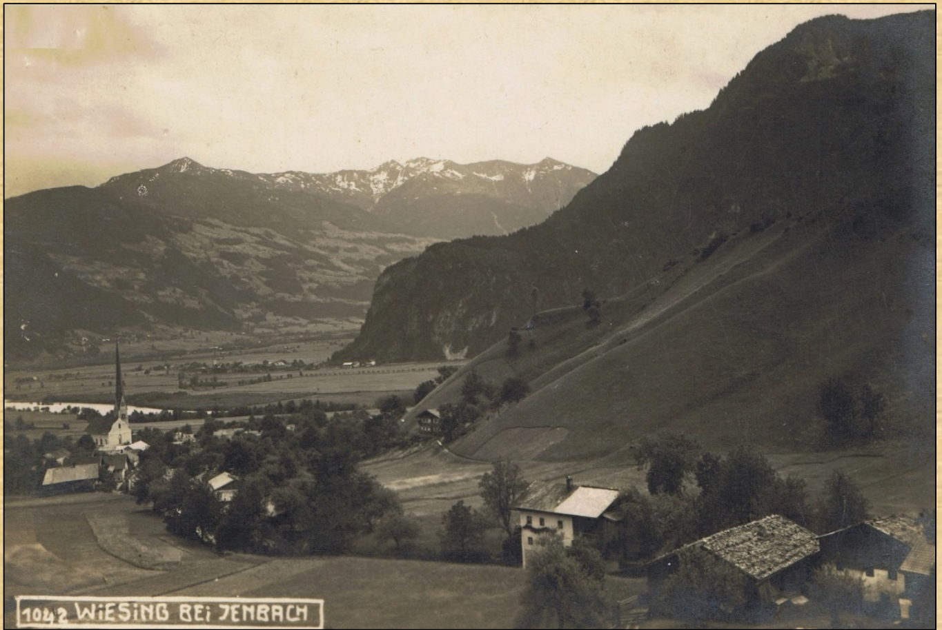
Oberdorf ca. 1935