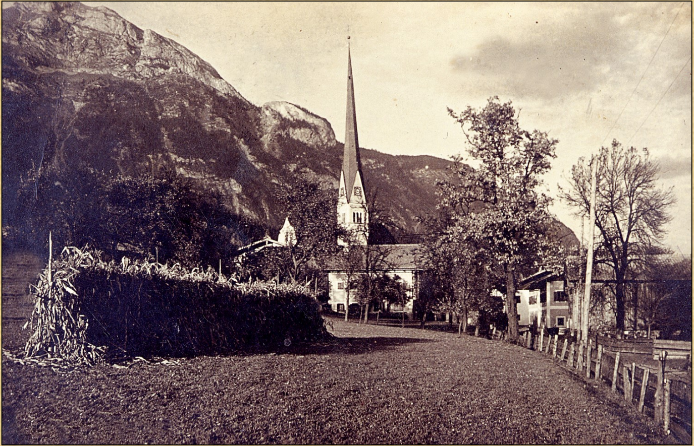
Westliche Ortseinfahrt ca. 1930