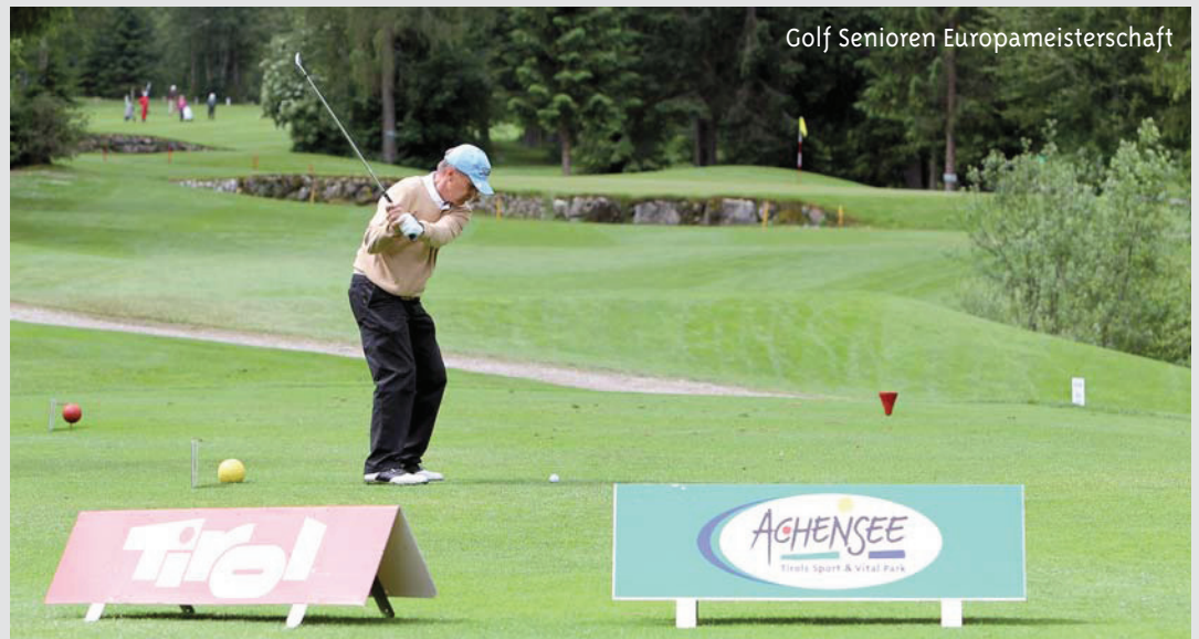
Golf Senioren Europameisterschaft

Mehr als 150 Teilnehmer aus ganz Europa werden bereits zum dritten Mal zur Golf-Europameisterschaft der Senioren von 12. bis 16. Juni 2012 in Pertisau erwartet. Bereits in den letzten zwei Jahren waren sie von der traumhaften Natur-