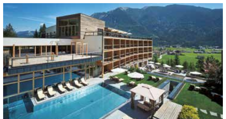
G.H. Betriebs GmbH. DAS KRONTHALER