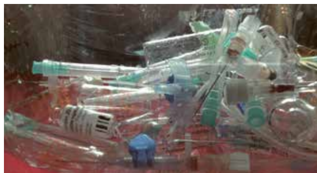
Medizinische Abfälle aus dem privaten Bereich können bei falscher Entsorgung gefährlich für Menschen, Tiere und die Umwelt werden.

Wahrscheinlich ist das WC auch oft der Entsorgungsweg für nicht verbrauchte bzw. abgelaufene Medikamente und sonstige Präparate. Man weiß, dass ein Großteil der Inhaltsstoffe von Medikamenten und auch Hormonpräparaten in den biologischen Abwasserreinigungsanlagen nicht abgebaut