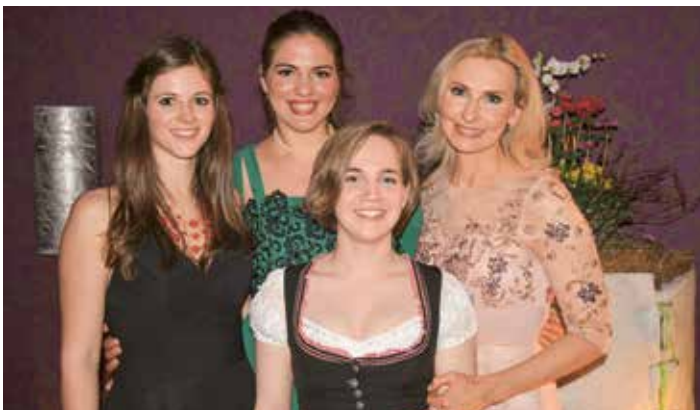
Eva Lind mit Studierenden der Musikakademie Tirol

Rund um die einwöchigen Meisterklassen findet im DAS KRONTHALER ein künstlerisches Wochenprogramm für kulturinteressierte Gäste statt. Am 8. Februar um 19.30 Uhr bildet das Abschlusskonzert im DAS KRONTHALER den krönenden Ausklang. Tickets & Sitzplatzreservierung unter +43 (0) 5246 6389.