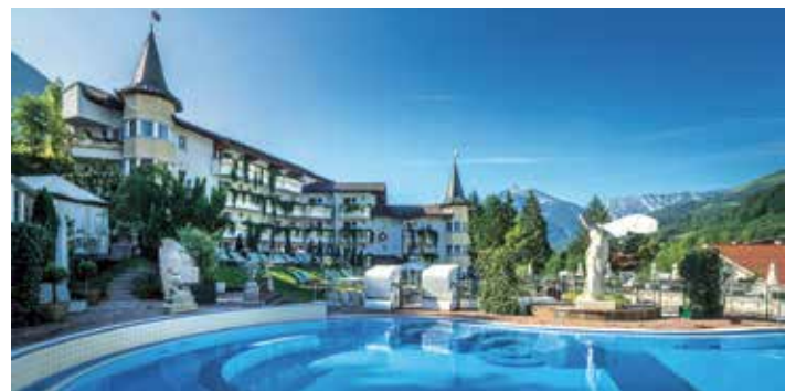
Karl Reiter Posthotel Achenkirch GmbH © Posthotel Achenkirch

Vielleicht kann man es ja auch als Ansporn für unsere zahlreichen Lehrbetriebe sehen. Achenkirch gehört in Tirol mit drei ausgezeichneten Betrieben zu den Spitzenreitern (tirolweit wurden 188 Betriebe ausgezeichnet).