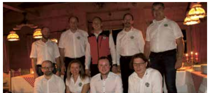
Der neugewählte Ausschuss

Wir wünschen dem neugewählten Ausschuss viel Erfolg in ihren Funktionen und bedanken uns recht herzlich beim „Alten Ausschuss“ für ihre langjährige und erfolgreiche Tätigkeit.