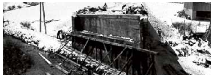
Bauarbeiten Achenseestraße im Bereich Seeachebrücke Rötzel