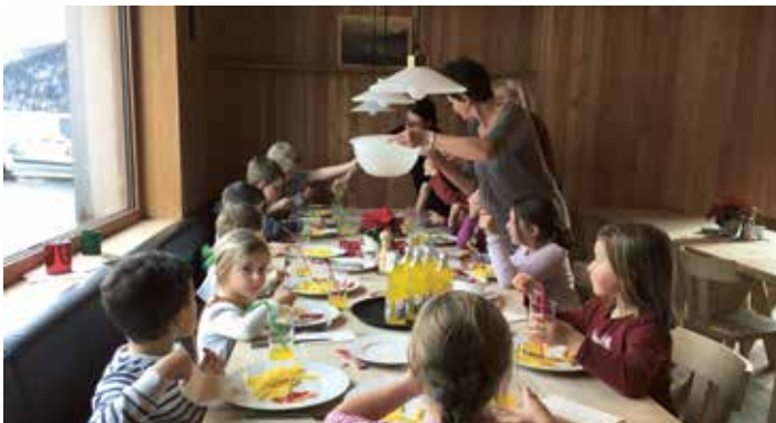
„Schnitzel und Pommes-Essen“ im Dorfhhaus Steinberg

Als Dankeschön für das zauberhafte Weihnachtsspiel mit dem bunten Programm an Gesang, instrumentalen Einlagen und Hirtenspiel, lud die Gemeinde Steinberg die Volksschulkinder und Kindergartenkinder ins Dorfhhaus zum „Schnitzel und Pommes-Essen“ ein. Allen schmeckte es sehr!