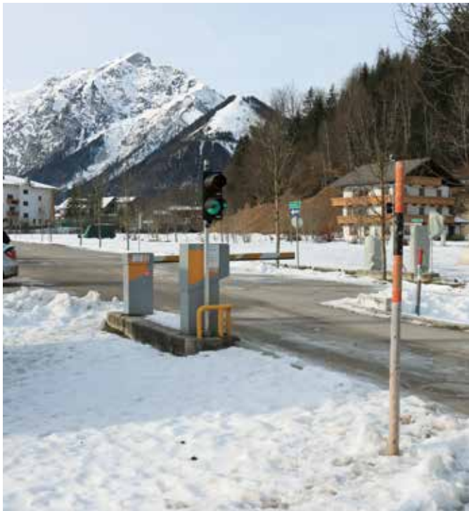
Parkplatz in Pertisau hinter dem Hotel Christina

In diesem Winter kann auch der Parkplatz bei der Schifffahrt genutzt werden. Dieser gebührenpflichtige Platz der TIWAG AG, hinter dem Hotel Christina, wird von der Gemeinde wintertechnisch betreut. Achtung: Hier gilt keine Vorteils-card!