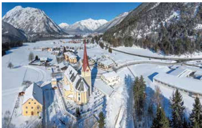
Eben am Achensee