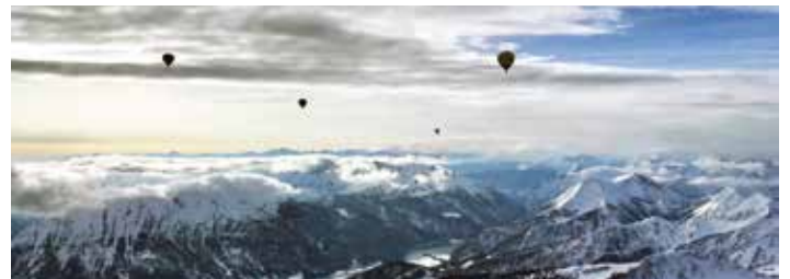
Ballonfahren über den Achensee