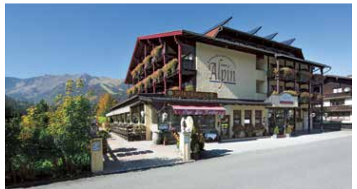
Kulinarikhotel der Familie Armin Gründler