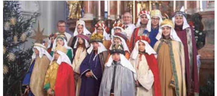
SternsingerInnen Eben am Achensee