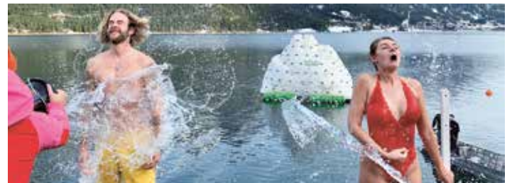
Insgesamt 106 TeilnehmerInnen waren am Start