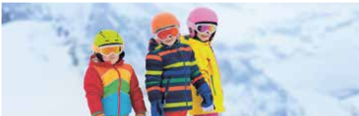
Kinder-Schitag Sportverein Achensee