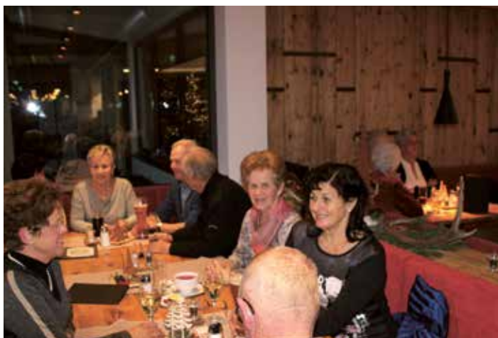
Weihnachtsfeier der SeniorInnen im Achentalerhof

Allen, die zum guten Gelingen unserer Feier beigetragen haben, möchten wir ganz herzlich danken. Ein ganz besonderer Dank gilt natürlich wieder dem Busunternehmen, das unsere SeniorInnen kostenlos befördert hat.