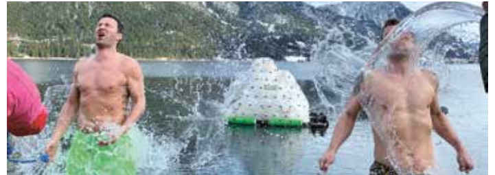
Vorbereitung für den Sprung in den Achensee