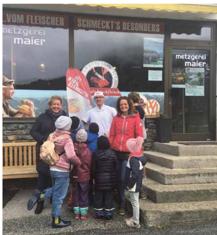
Besuch bei der Metzgerei Maier