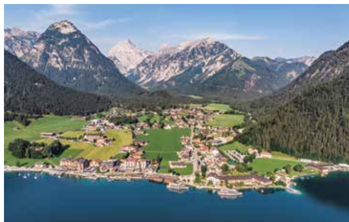
Pertisau am Achensee