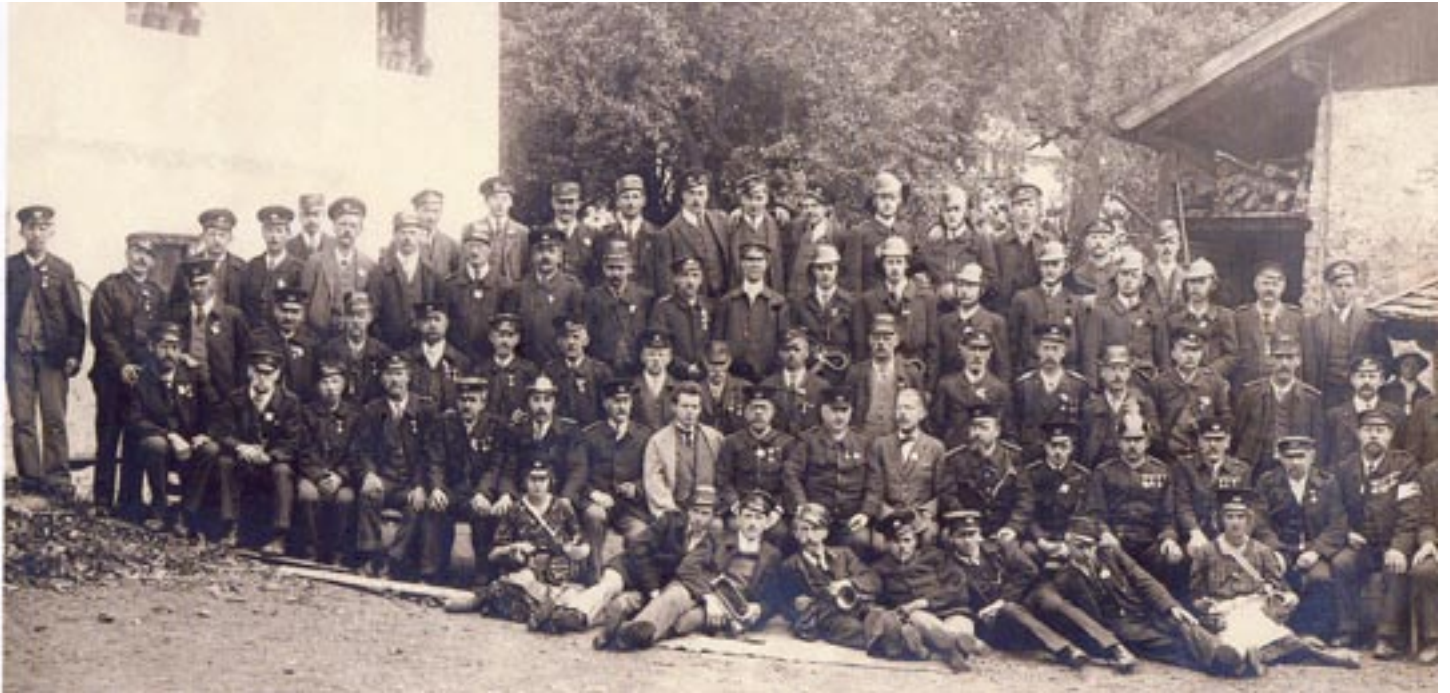
Foto der Wiesinger Feuerwehr um 1920

Auf dem Bild ist die Wiesinger Feuerwehr um 1920 zu sehen!