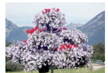
Augenweiden – gestaltet und betreut vom Gartenbauverein Achensee.