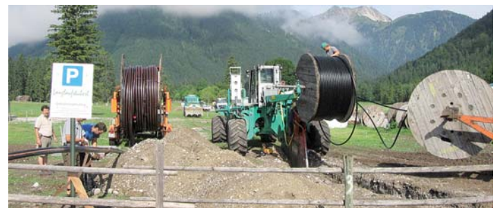
Die Arbeiten am Kanalbau im Falzturn- und Gerntal schreiten schnell voran. Die Pflugarbeiten wurden bereits fertig gestellt. Bei diesem Verfahren wurden der Abwasserschlauch und ein Stromkabel gleichzeitig verlegt. Die Arbeiten werden im Herbst abgeschlossen sein und dann wird das Schmutzwasser seine Reise über den Kanal nach Strass zum Klärwerk antreten können.