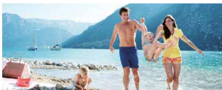
Badespaß am „Tiroler Meer“

Der Achensee bietet im Sommer 2020 genau das, was seinem touristischen Ursprung entspricht und liegt gerade deshalb heuer voll im Trend: Die „Tiroler Sommerfrische“ war und ist nachhaltiges Urlaubsvergnügen in der naturbelassenen Umgebung am „Tiroler Meer“. Die Gäste der Region erwarten ein vielfältiges Angebot, das diese traditionsreiche Urlaubsform am Ort ihres Entstehens umso attraktiver macht.