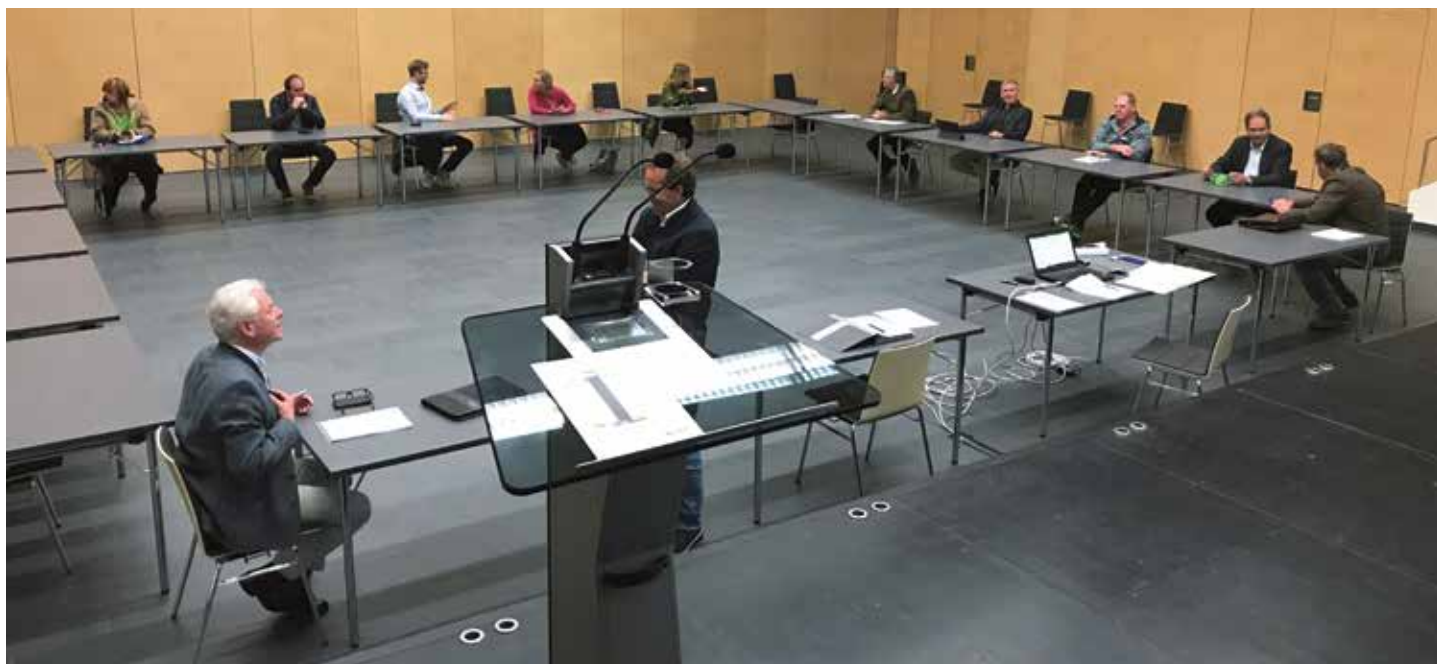
Die Sitzung des Gemeinderates am 14. Mai 2020, fand zur Ermöglichung der Einhaltung der Abstandsvorgaben im Veranstaltungssaal des Gemeindezentrums in Maurach statt

Seitens der Tiroler Wasserkraft AG ist beabsichtigt, im Bereich des Gst 1314 - zwischen Fürstenhaus und Fischergut - eine 36 kV-Leitung sowie Kabeln zur Übertragung von Nachrichten zu verlegen. Gemäß dem vorliegenden Vertrag sollen der TIWAG die entsprechenden Dienstbarkeiten zugesichert werden. Es ist eine einmalige Abfindung von EUR 476,00 vorgesehen und weiters eine Verlegeverpflichtung, falls die Kabel künftige Bauführungen behindern. Die Gemeindestraße wird in diesem Fall zur Kabelverlegung nicht aufgegraben, sondern erfolgt eine „Durchbohrung“ der Straße. Der Gemeinderat genehmigt einstimmig den Abschluss des vorliegenden Dienstbarkeitszusicherungsvertrages mit der TIWAG.