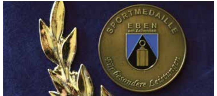
Sportmedaille der Gemeinde Eben am Achensee