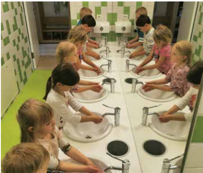
Händewaschen gehört zum Alltag dazu

Die letzten Wochen verliefen auch im Kindergarten nicht, wie wir es gewohnt sind. Waren es zu Beginn der Einschränkungen teilweise nur ein, zwei Kinder, die im Kindergarten heruntollten, so werden es inzwischen wieder mehr. Langsam kehrt so etwas wie Normalität ein. Das Händewaschen war schon immer ein wichtiger Aspekt. Die Kinder lernen von Beginn des Kindergartenjahres an, dass das Händewaschen einfach zum Alltag dazu gehört. Jetzt ist es noch wichtiger geworden und gemeinsam nehmen wir uns mehrmals täglich die Zeit dazu. Platz und Zeit zum Spielen nach Herzenslust bleibt natürlich auch und wir stellen fest, dass die Kinder einfach nur glücklich sind, endlich wieder ihre Freunde treffen und miteinander spielen zu können.