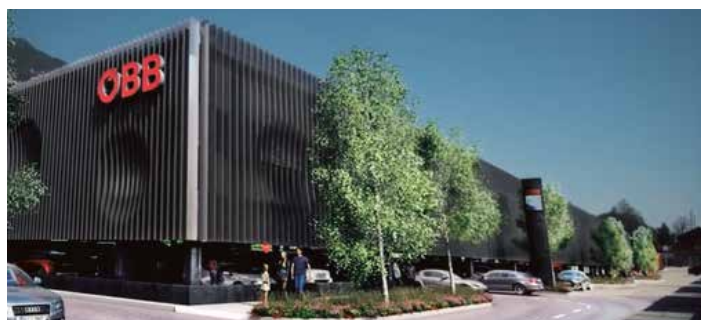
Neues Parkdeck am Bahnhof Jenbach