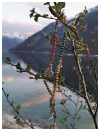
Begleiter beim Spaziergang

In den Gedanken zum Sonntag habe ich öfters auf die Hauskirche hingewiesen und dazu eingeladen, Bilder an die Pfarren zu schicken, um eine Vielfalt zu spüren. Jede/r hat ihren/seinen Weg im spirituellen Bereich gefunden und soll ihn weiterhin vertiefen. Ich möchte euch drei Bilder zeigen, die Menschen aus dem Seelsorgeraum zur Verfügung gestellt haben. Pastoralassistent i. A. Markus Leitinger