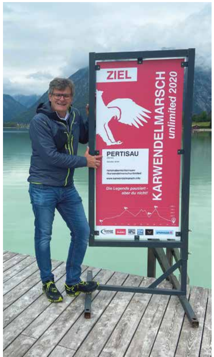
Einer der fünf Karwendelmarsch Check Points

Die Registrierung zum Karwendelmarsch 2020 unlimited ist kostenlos. TeilnehmerInnen, die bereits für den diesjährigen Karwendelmarsch angemeldet waren, können entweder ihren Startplatz auf 2021 übertragen oder ihn bis 31. Juli 2020 zurückgeben und ihr Geld rückerstattet bekommen. Der Verkauf, der für 2021 frei gewordenen Startplätze, erfolgt Ende 2020 ausschließlich über den Veranstalter - um die sportliche und preisliche Fairness zu garantieren, wird es keine Startplatzbörse geben.