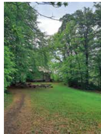
Platz für Gemeinschaft