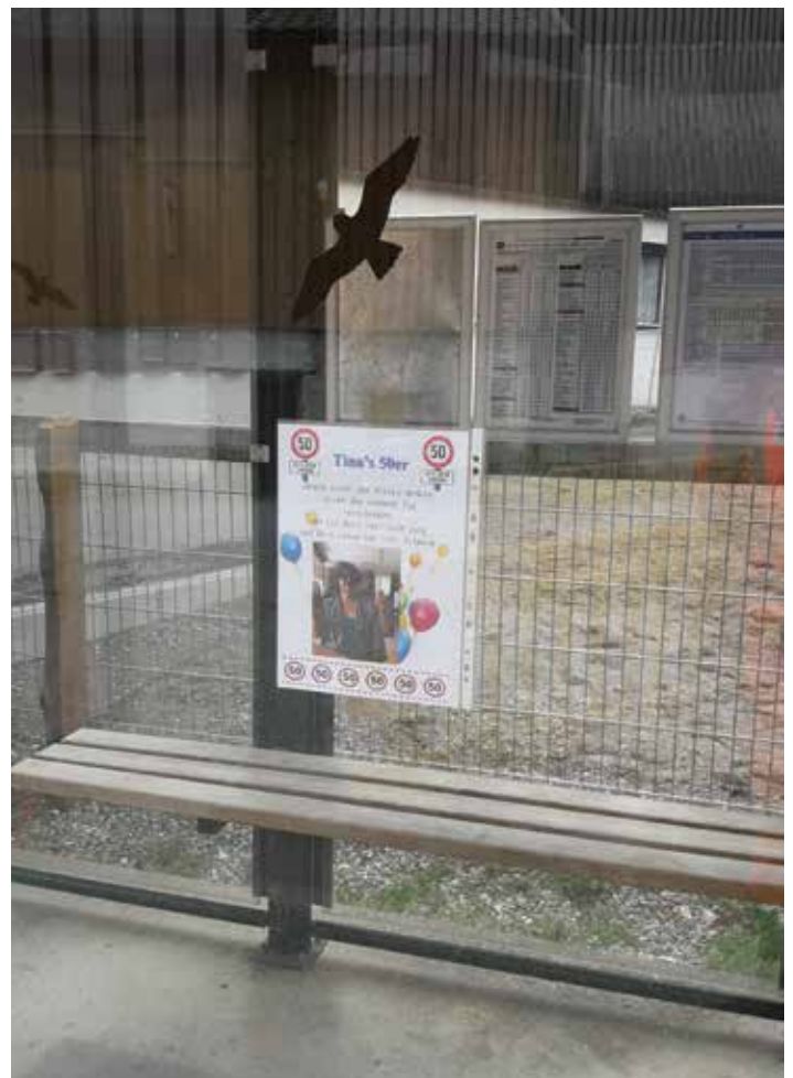
Plakatieren des Buswartehäuschen

Wir haben daher an euch alle den Wunsch, dass zukünftig bei solchen Veröffentlichungen auf die Anbringung von Plakaten im Bereich der öffentlichen Einrichtungen - Buswartehäuschen, Straßenlampen, Verkehrszeichen udgl. - verzichtet wird, um uns allen diesen Ärger beim Entfernen der Plakate zu ersparen.