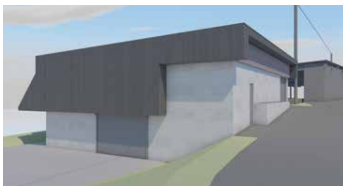
Ansichten des Gemeindebauhofes