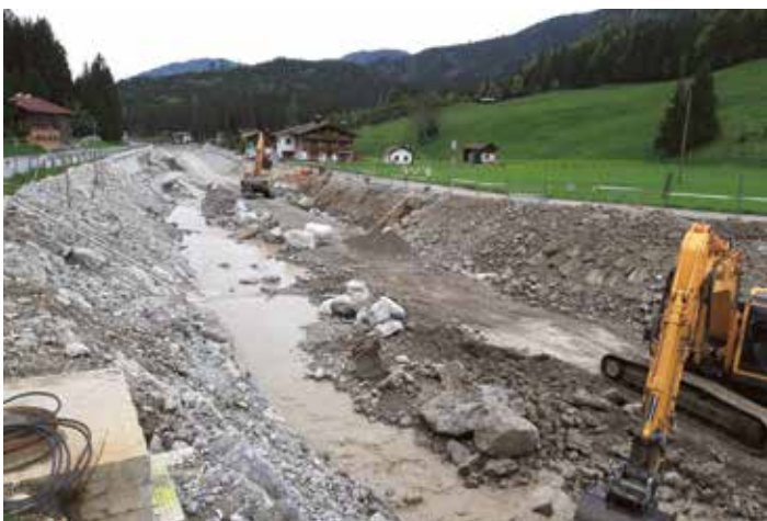
Regulierung Seeache - Bauabschnitt Bereich Jasssteg

Bei den Arbeiten für die Regulierung der Seeache beim Bauabschnitt Jasssteg bis Haapo ist man nunmehr auch bereits orographisch oberhalb des Jasssteges angelangt. Die Arbeiten bis zur Brücke (Auerbrücke oder Jasssteg) sind in der Endphase. Es wurde auch bereits mit den Arbeiten südlich der Brücke begonnen. Hier soll als erstes der rechtsufrige Bereich bis zur Seeachebrücke ausgeführt werden.