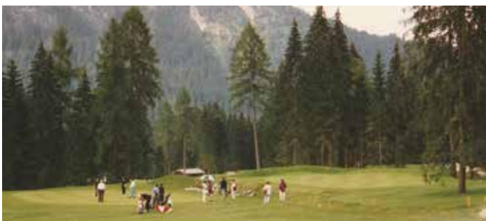
Früher wie heute ein beliebter Sport in unserer wunderschönen Natur