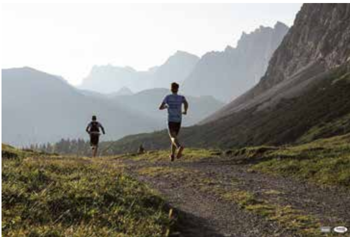
Karwendelmarsch 2020 unlimited

Wer sich online für einen Startplatz angemeldet hat, muss anschließend nur noch seine Starterkarte beim Infozentrum Scharnitz abholen und die Wandernadel-App „SummitLynx“ kostenfrei installieren. Die Originalstrecke des Karwendelmarsches ist bereits in der App angelegt. Unterwegs gibt es fünf Checkpoints: Start - Karwendelhaus - Eng - Gramai - Pertisau. Diese werden direkt auf der Strecke stehen, im Design des Karwendelmarsches den Weg leiten und nebenbei noch als perfekte Selfie-Spots dienen.