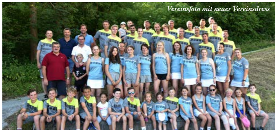
Vereinsfoto mit neuer Vereinsdress