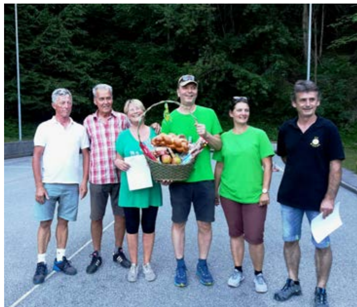
Das Dorfmeisterteam Stalingrad