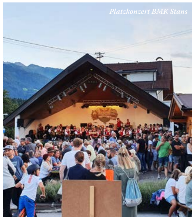
Platzkonzert BMK Stans

Bereits Anfang Oktober werden wir mit den Proben für das Cäcilienkonzert, am 23. November 2019 in der Pfarrkirche Wiesing beginnen. Wir würden uns sehr freuen, auch dort wieder viele musikbegeisterte Wiesingerinnen und Wiesinger begrüßen zu dürfen und euch auch mit etwas ruhigerer Musik als bei den Platzkonzerten begeistern zu können.