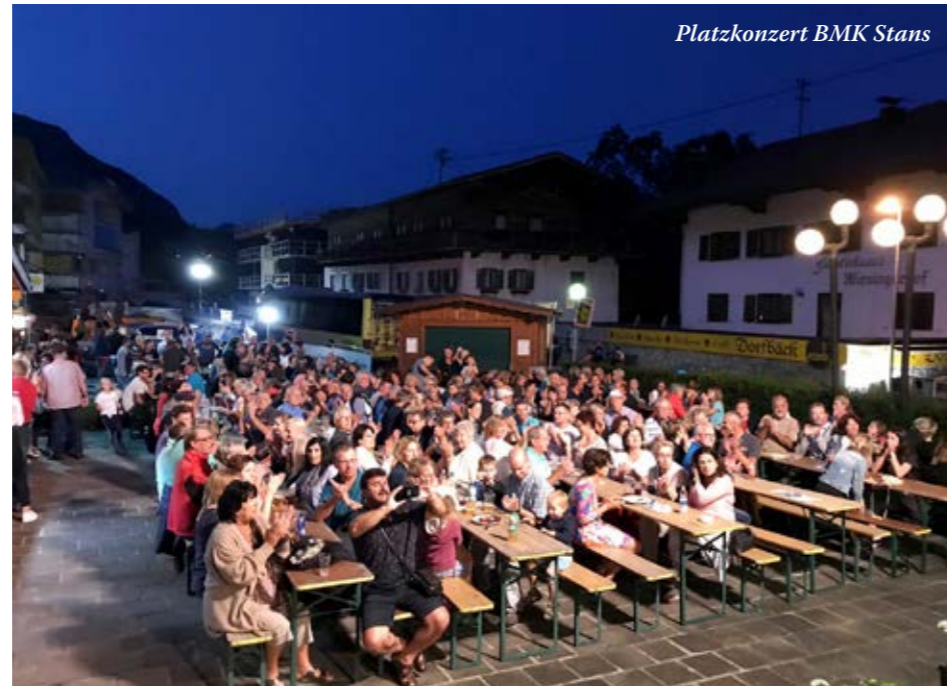
Platzkonzert BMK Stans

Mit dem Ende der Platzkonzerte neigt sich das Musikjahr 2019 schön langsam dem Ende zu. Neben zahlreichen Ausrückungen für kirchliche und öffentliche Anlässe, lud die BMK Wiesing heuer unter dem Motto „Kemmts Musig losn“ zu 10 Platzkonzerten ein. Bei drei unserer Konzerte durften wir befreundete Musikkapellen aus unserer Umgebung begrüßen. So waren die BMK Terfens, die BMK Münster und die BMK Stans bei uns im Musikpavillon zu Gast. Wir wiederum durften Austauschkonzerte in Terfens, Münster und beim Bezirksmusikfest in Stans zum Besten geben. Ein besonderes Highlight war für uns sicherlich das Austauschkonzert beim „Millander Dorffest“ in Südtirol Anfang August. Wo wir ein unvergessliches Wochenende erleben durften. In guter Erinnerung wird uns auch das Austauschkonzert mit der BMK Stans bleiben, welches wir als Benefizkonzert für die Familie eines tragisch verunglückten Musikkameraden aus Stans veranstalteten. Zahlreiche Musikbegeisterte aus nah und fern folgten unserer Einladung und wurden, neben